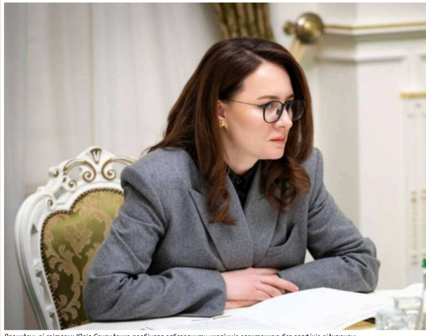
Великдень зі світлом: Юлія Свириденко пообіцяла забезпечити українців електрикою без графіків відключень

Прем'єр-міністерка Юлія Свириденко провела координаційну нараду з керівництвом "Укренерго" та іншими причетними щодо поточної ситуації в енергосистемі.