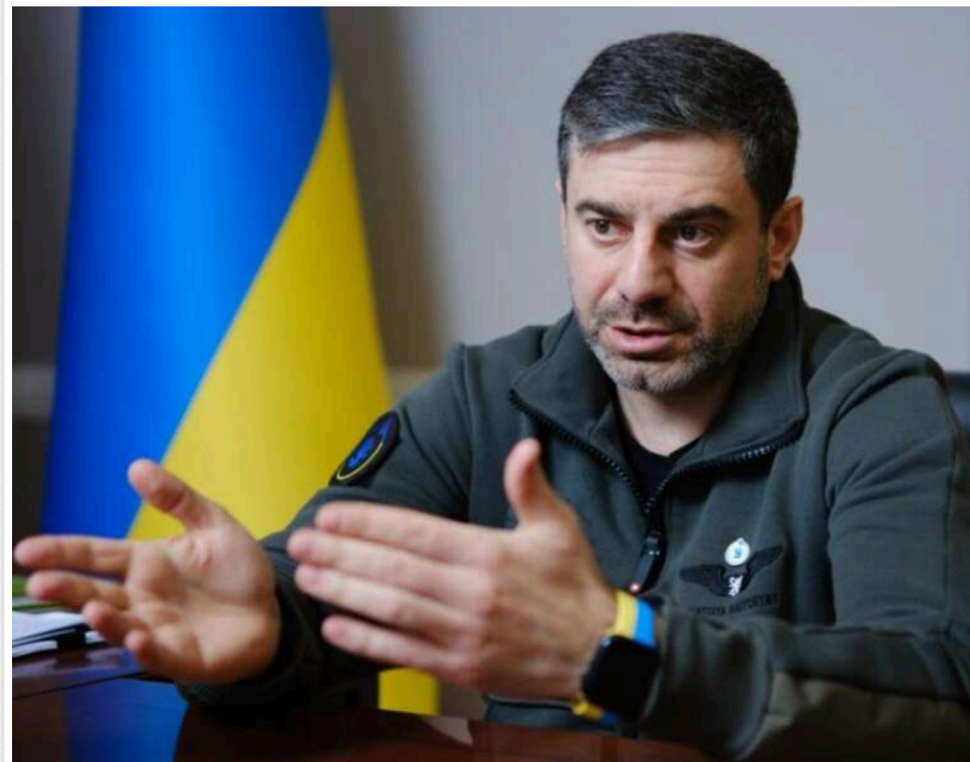
Лубінець: ТЦК фактично перетворилися на місця позбавлення свободи громадян

Омбудсмен Дмитро Лубінець заявив, що ТЦК фактично перетворилися на місця позбавлення свободи громадян.