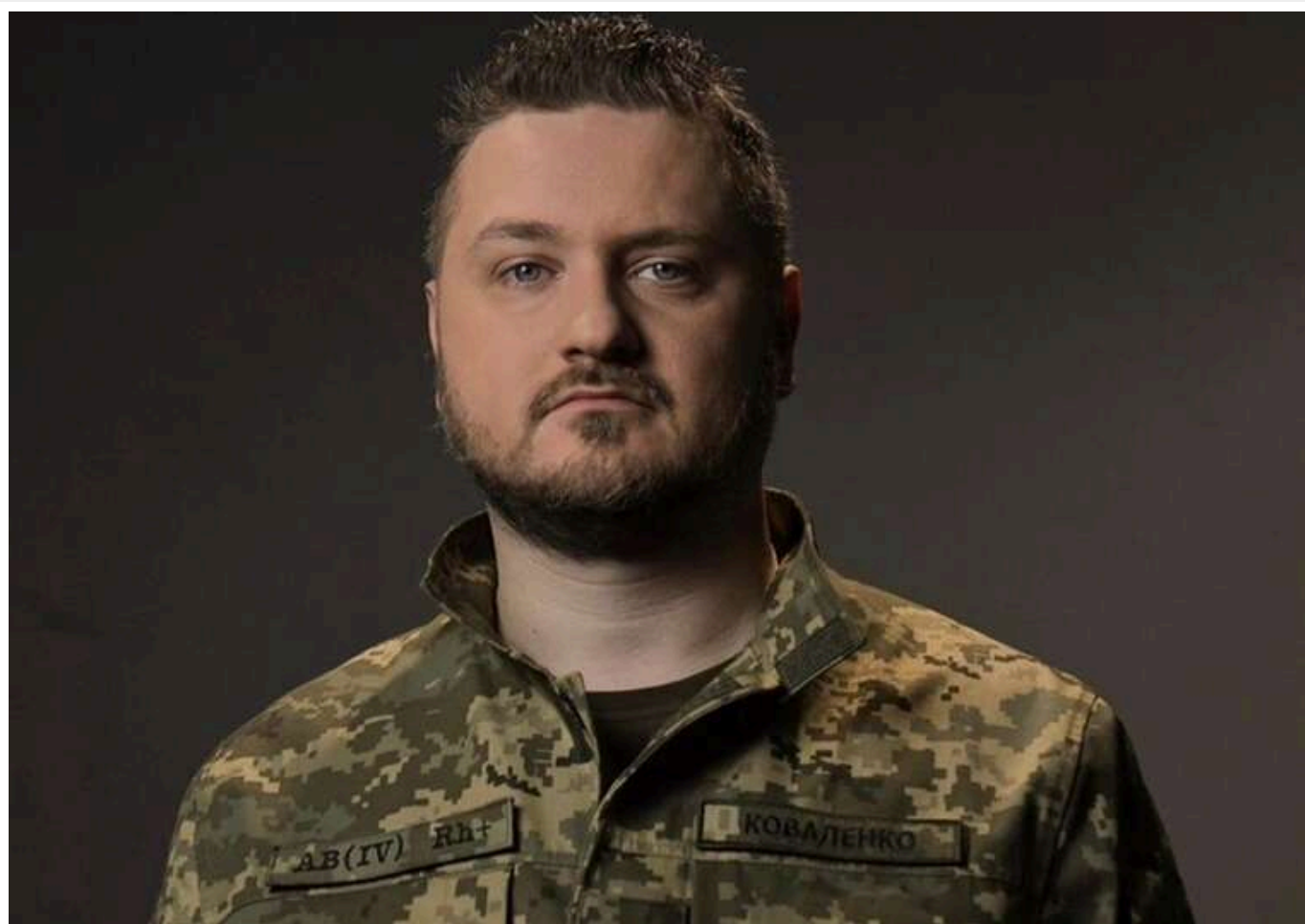
«Конвеєр безумства і смерті»: у ЦПД відповіли на заяву Путіна про «щоденний наступ»

Російський диктатор Володимир Путін заявив, що війна наближається до завершення, а його "армія наступає щодня". Але ціна цього "наступу" - десятки тисяч загиблих на місяць.