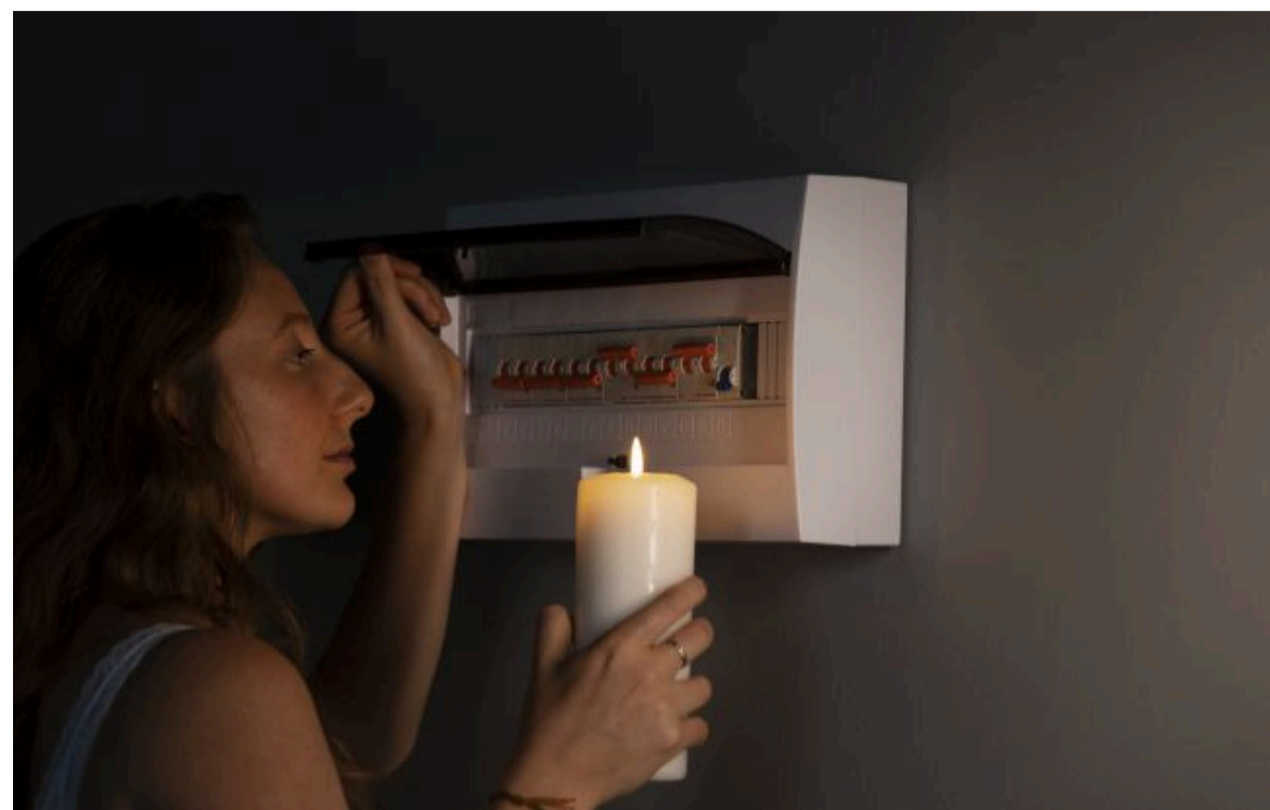
Фото: через аварію на ТЕЦ частина Одеси залишилася без електропостачання