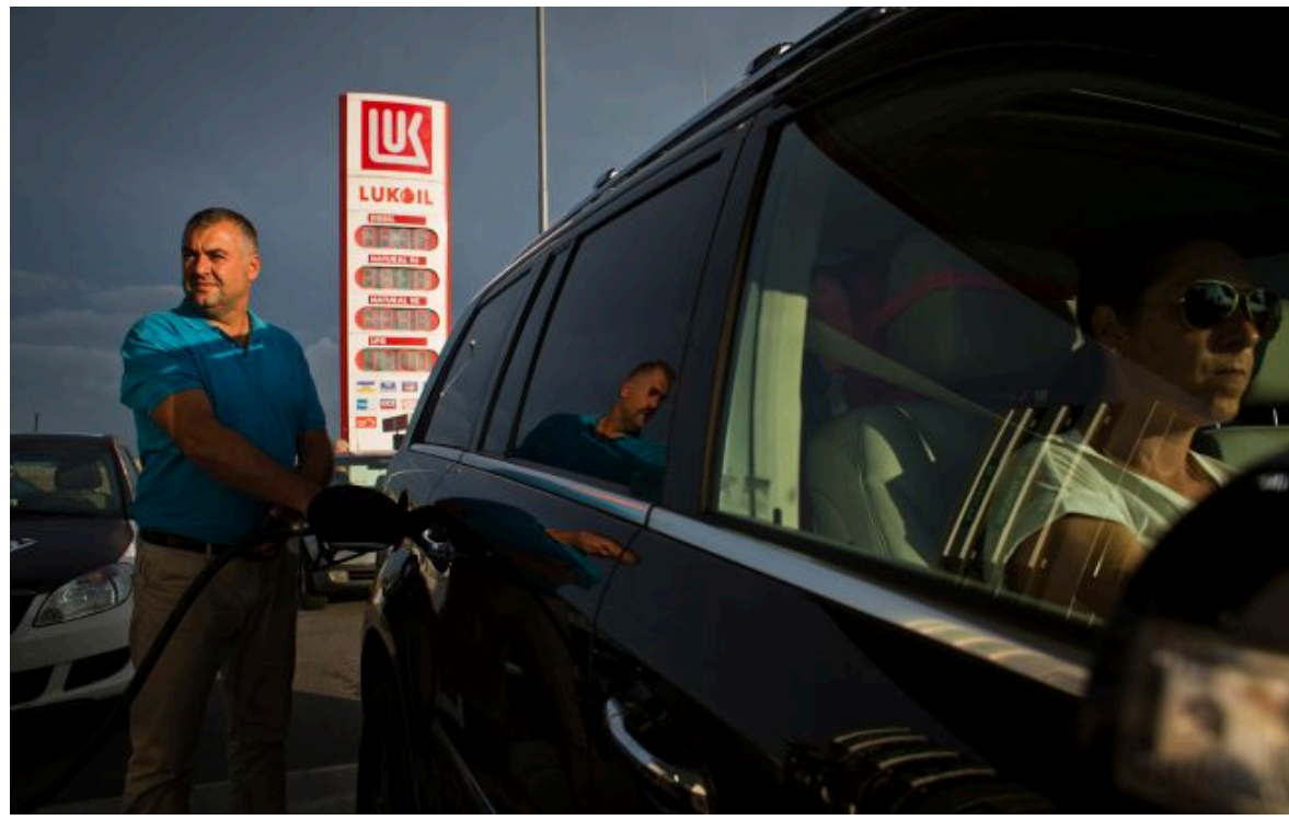
Фото: у Криму повністю припинили продаж палива на АЗС