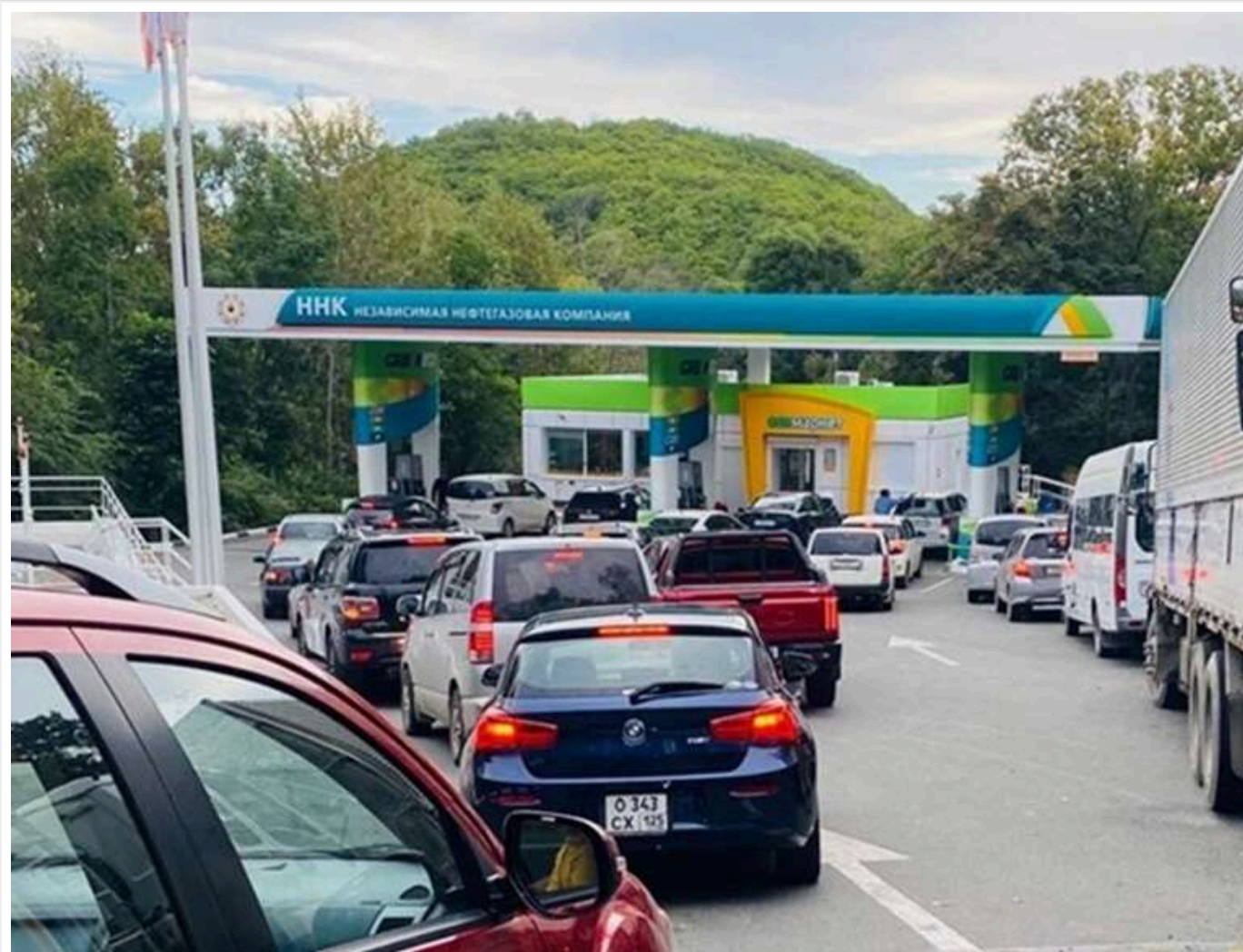
Бензинова криза в РФ: ISW заявив про масовий дефіцит пального та зростання цін через удари ЗСУ

Читати на руськом Додати як бажане джерело в Google