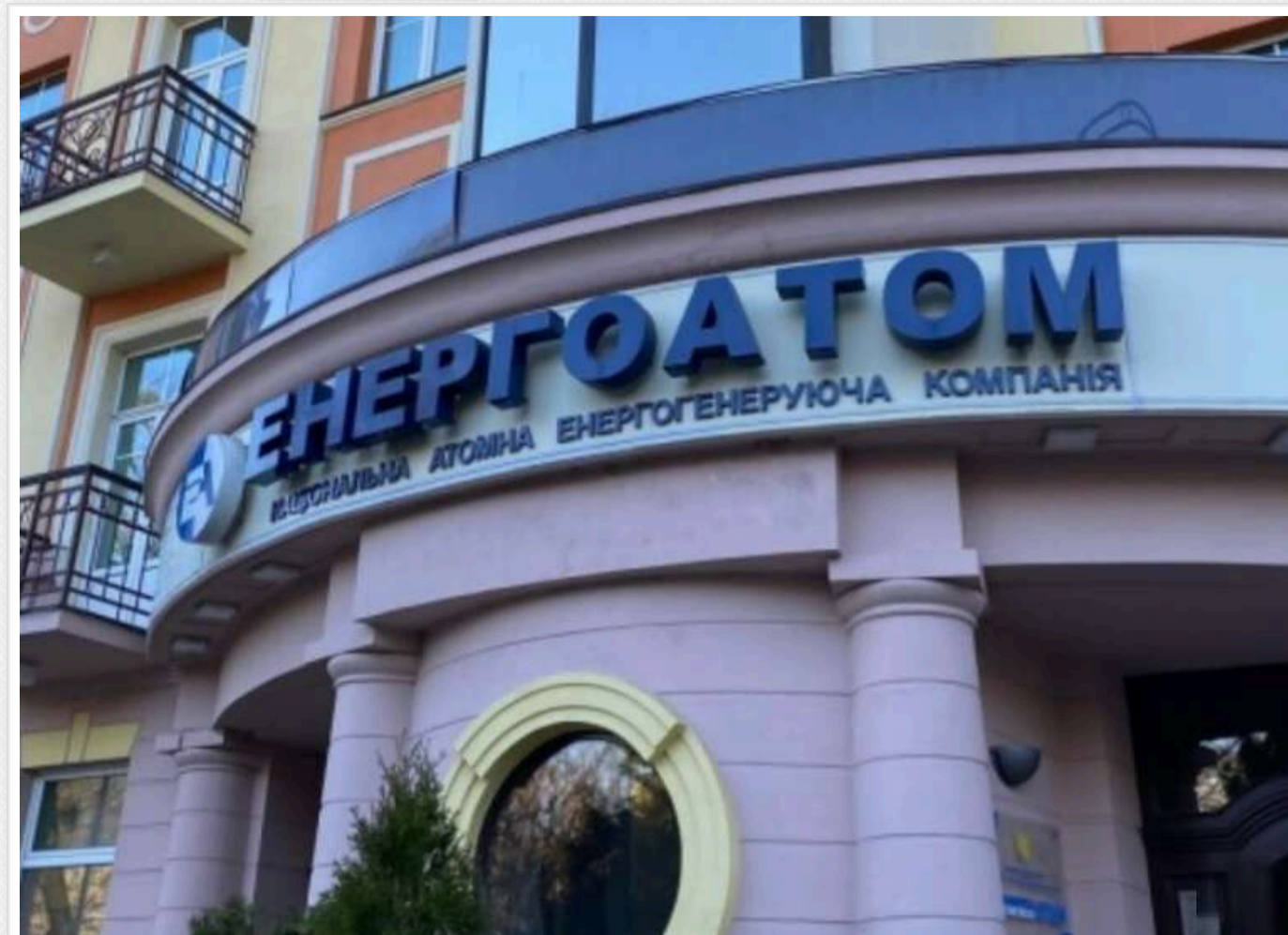
Синхронізація з «планом США»: Die Zeit пов'язало корупційний скандал в «Енергоатомі» з тиском на Зеленського щодо завершення війни

Німецьке видання Die Zeit опублікувало розслідування під назвою Attack from within , в якому заявлено про можливий зв'язок корупційної справи навколо «Енергоатому» з міжнародними переговорами щодо завершення війни в Україні.