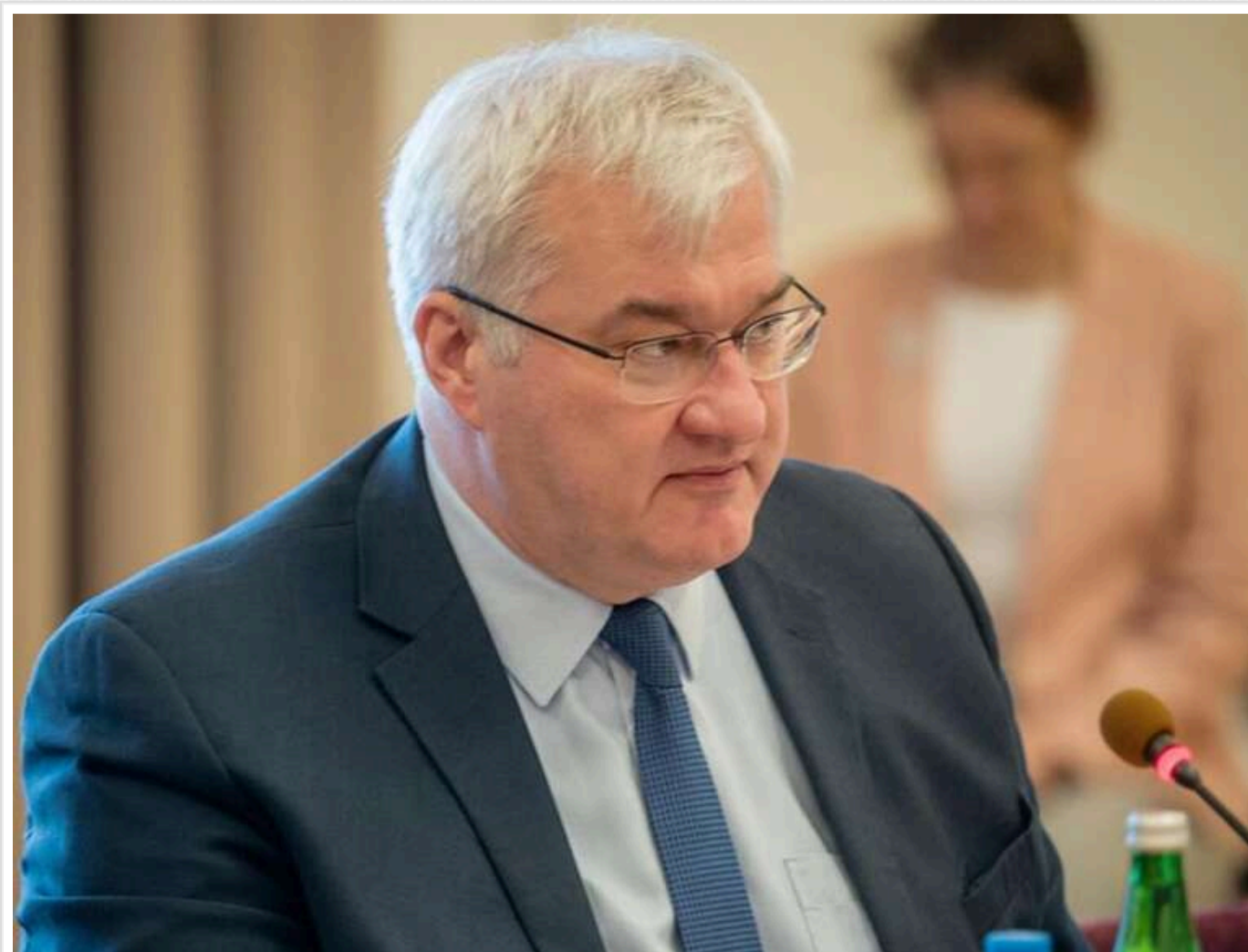
Вступ України до ЄС та НАТО є безпековим активом для самої Європи, – глава МЗС Сибіга

Читати на руськом Додати як бажане окремо в Google