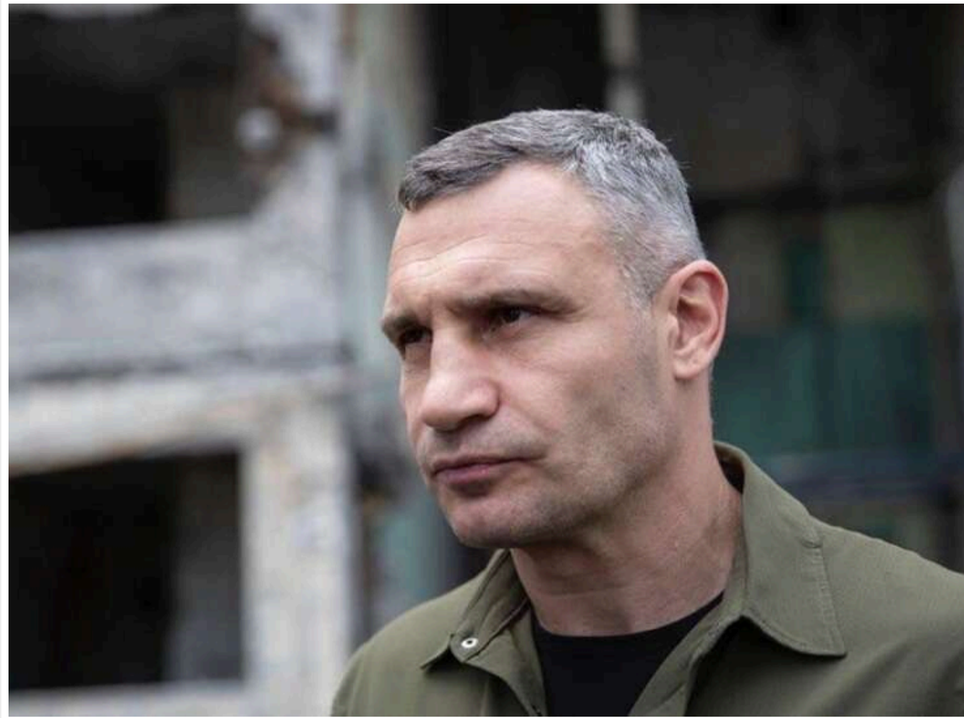
Мер Києва Віталій Кличко показав масштаби руйнувань у Подільському районі після повторного удару

Мер столиці Віталій Кличко опублікував у своєму телеграм-каналі відеозвіт із місця ліквідації наслідків масованої атаки в Подільському районі.