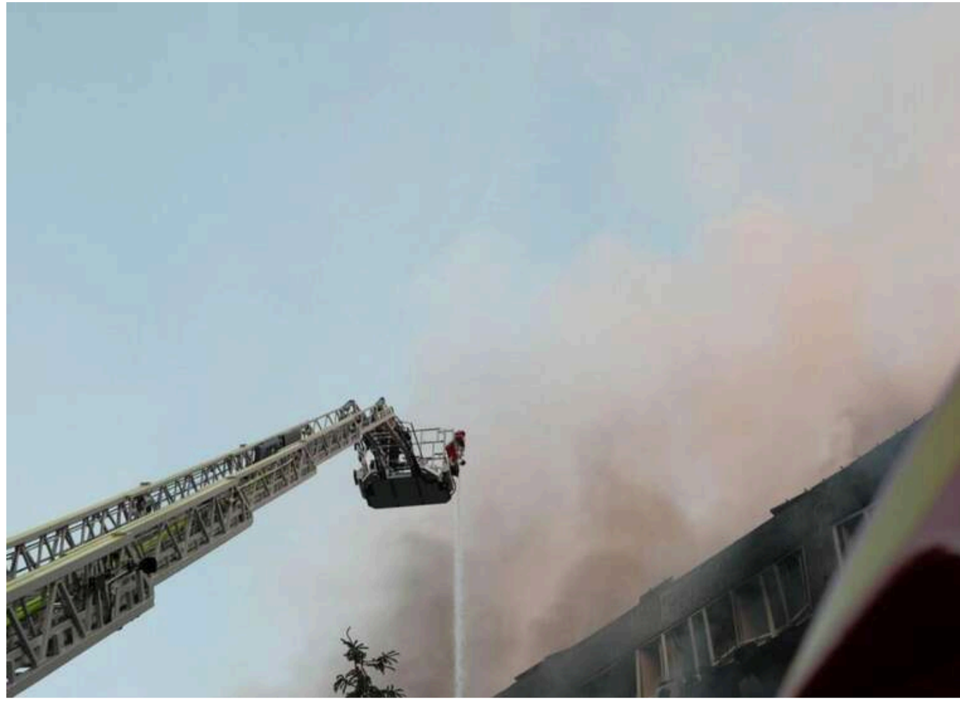
Кривавий наліт 2 червня: 13 загиблих та понад 100 поранених в Україні, в Дніпрі загинув майор ДСНС

Читати на руськом Read in English Додати як бажане джерело в Google