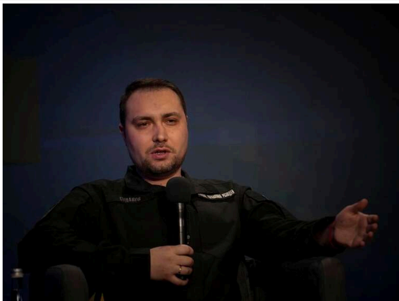
Фінський експерт оцінив роль очільника ОП Буданова в переговорах із Росією