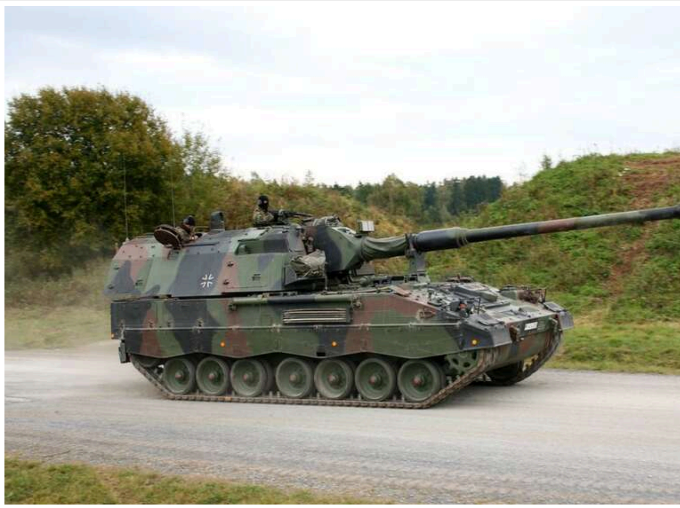
ISW: Росія активізує фейкові звинувачення проти ЗСУ для виправдання ударів по цивільних

Російська Федерація останнім часом значно активніше використовувала сфабриковані звинувачення на адресу Збройних сил України для виправдання власних терористичних ударів по цивільних об'єктах. Окупанти намагаються надати своїм руйнівним нальотам легітимного статусу, маскуючи їх під акти помсти за нібито атаки по мирному населенню.