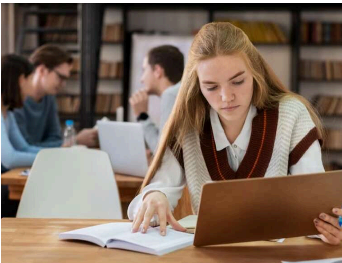
Поки держава намагається втримати молодь, діти українських топчиновників та депутатів навчаються за кордоном за мільйони гривень

Читати на русском, Read in English, Додати як бажане джерело в Google