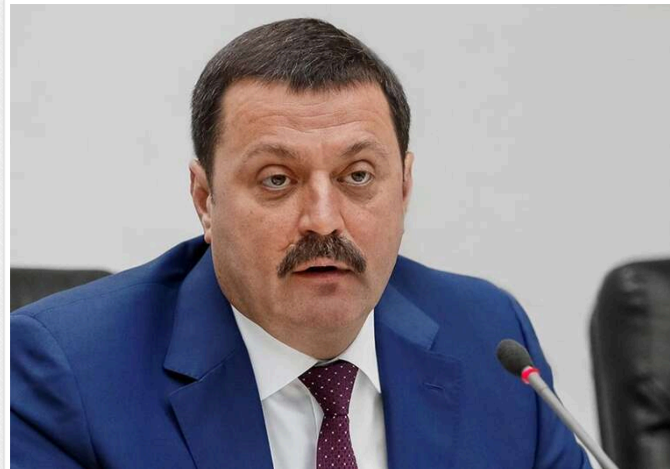
Тінь Деркача на оборонних закупівлях: як великий постачальник Міноборони пов'язаний із підсанкційним російським сенатором

Читати на руском Read in English Додати як бажане джерело в Google