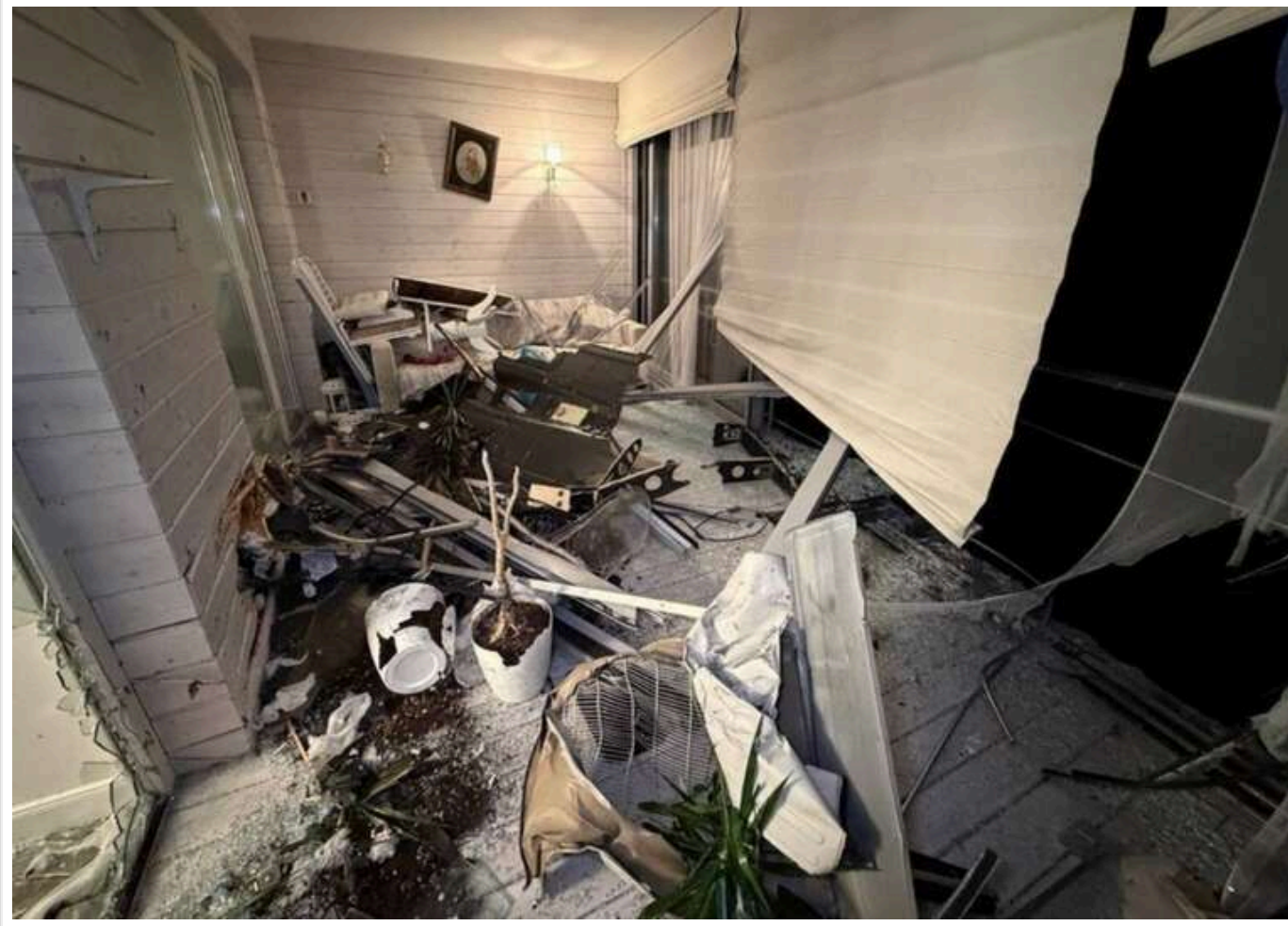
Ворог атакував Одесу «шахедами»: пошкоджено два житлові будинки, є поранена

Читати на руском Read in English Додати як бажане джерело в Google