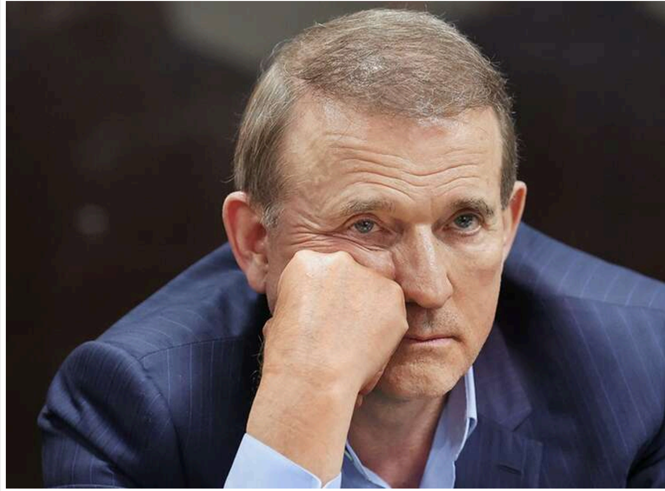
Державі повернули 10 гектарів лісу на Київщині, які понад 20 років контролювали структури зрадника Медведчука

Читати на руском Read in English Додати як бажане джерело в Google