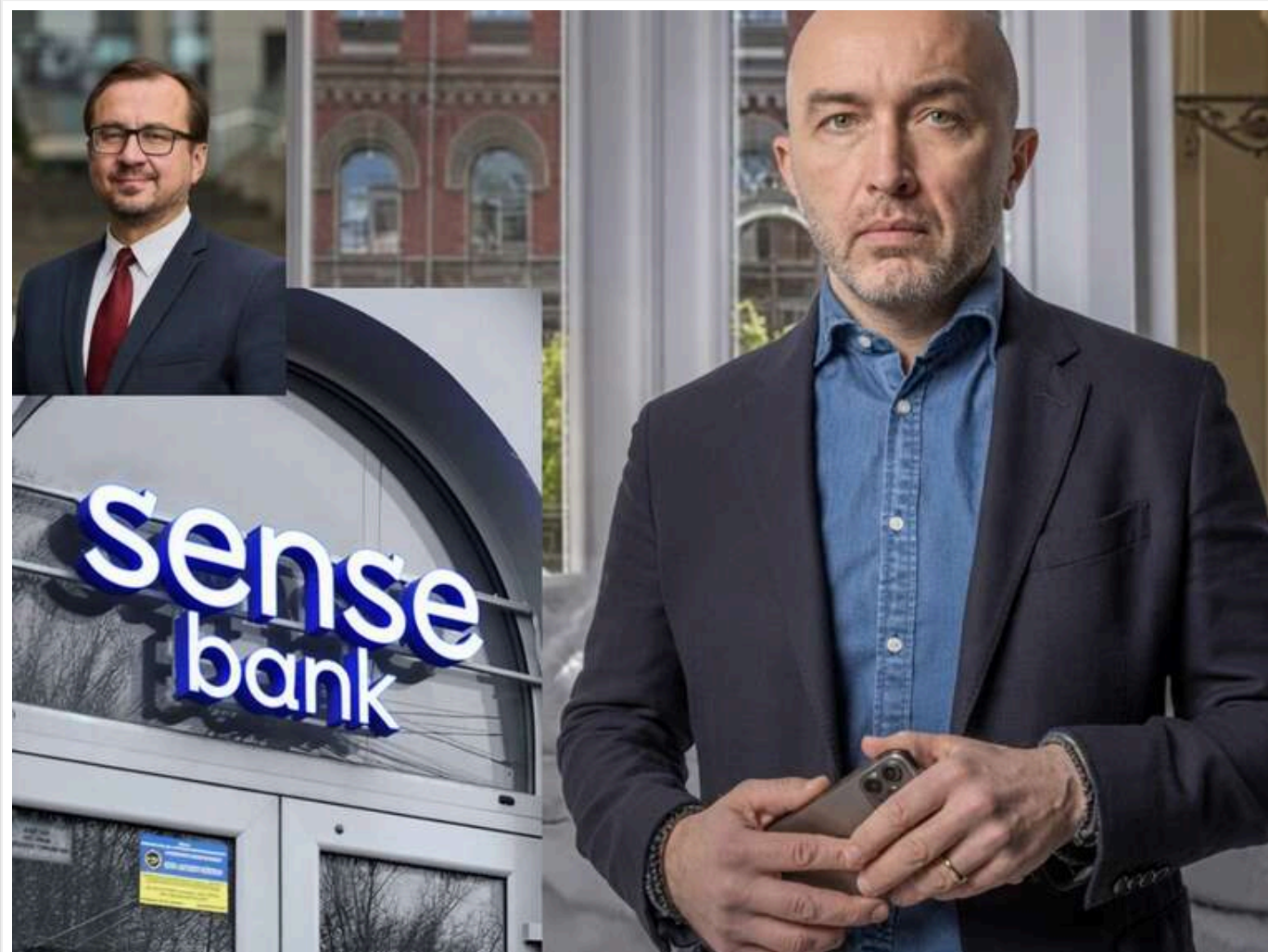
Списки від «Мідаса» та протекція Пишного: як «Сенс Банк» легалізує призначену за вказівкою згори наглядову раду

Читати на руском Read in English Додати як бажане джерело в Google