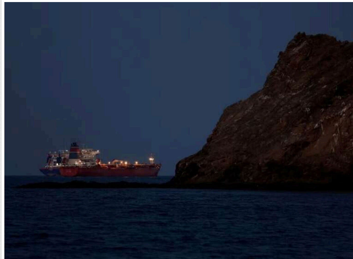
Нафтова блокада: Іран повністю закрив Ормузьку протоку після нічних авіаударів США