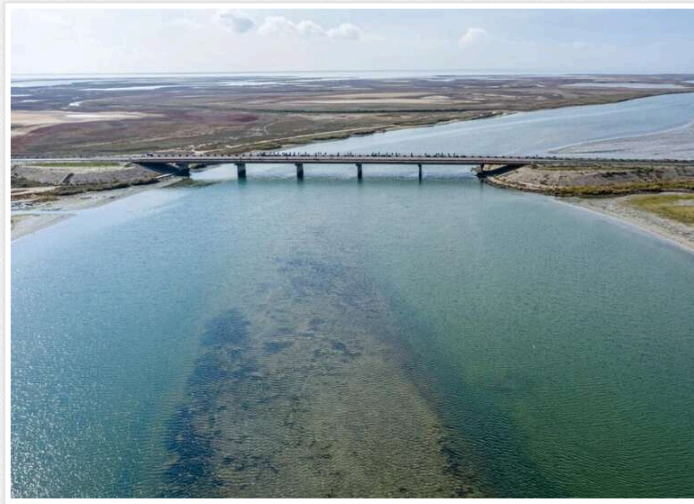
На ТОТ Херсонщини пошкоджено мости через Північнокримський канал та в напрямку Криму

На ТОТ Херсонщини пошкоджені мости через Північнокримський канал.