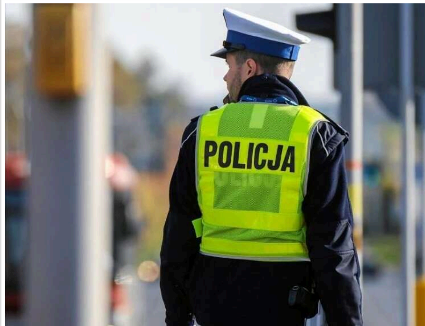
У Вроцлаві викрали двох 20-річних українців і катували їх у підвалі ресторану; затримано чотирьох іноземців

Наприкінці травня у Вроцлаві двоє 20-річних українців стали жертвами викрадення. Їх заманили на вулиці, силою посадили в машину і вивезли в підвал одного з закладів громадського харчування в центрі міста.