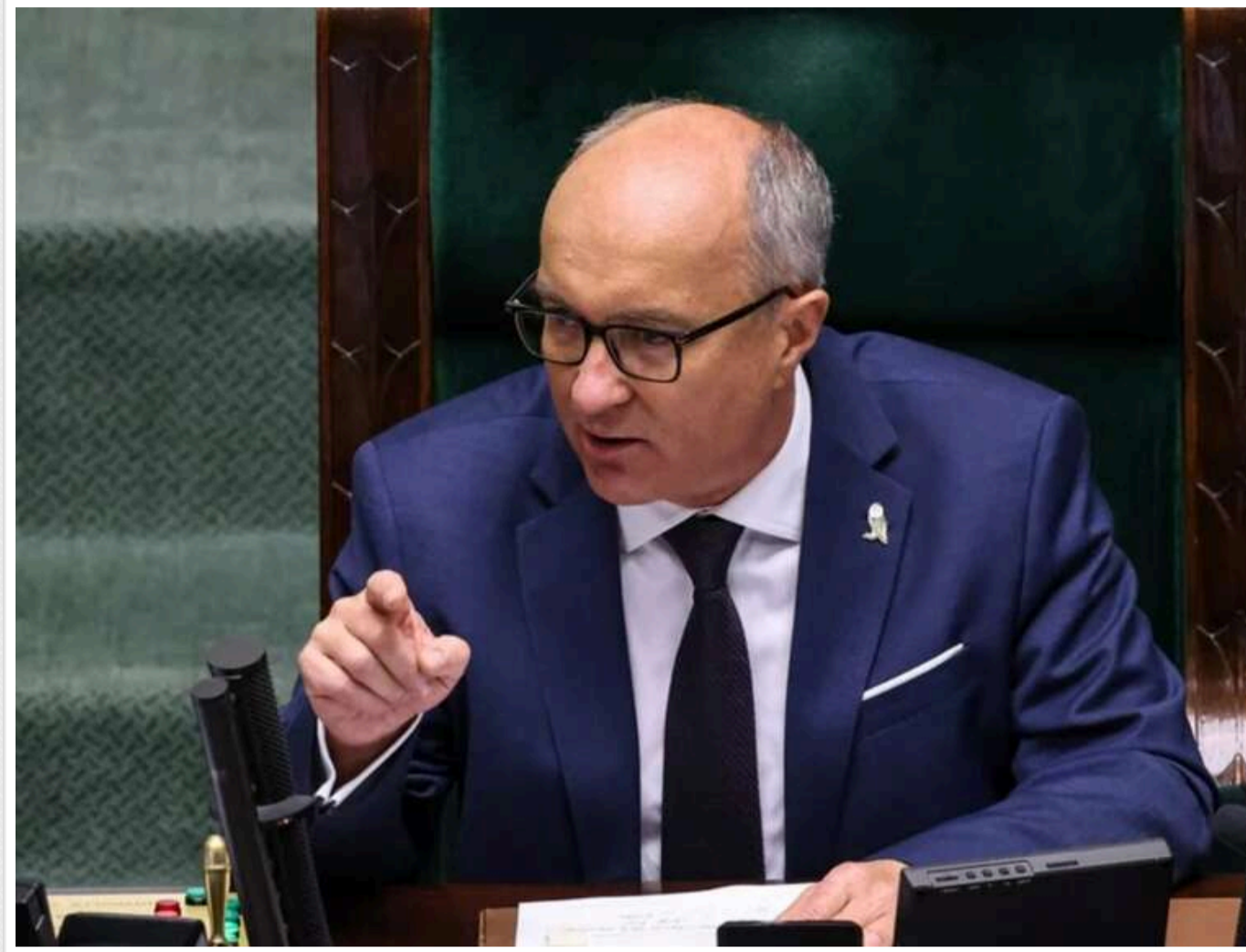
У Сеймі Польщі виникла гостра дискусія через пропозицію перевіряти чиновників на українське походження

Читати на руском Додати як бажане джерело в Google