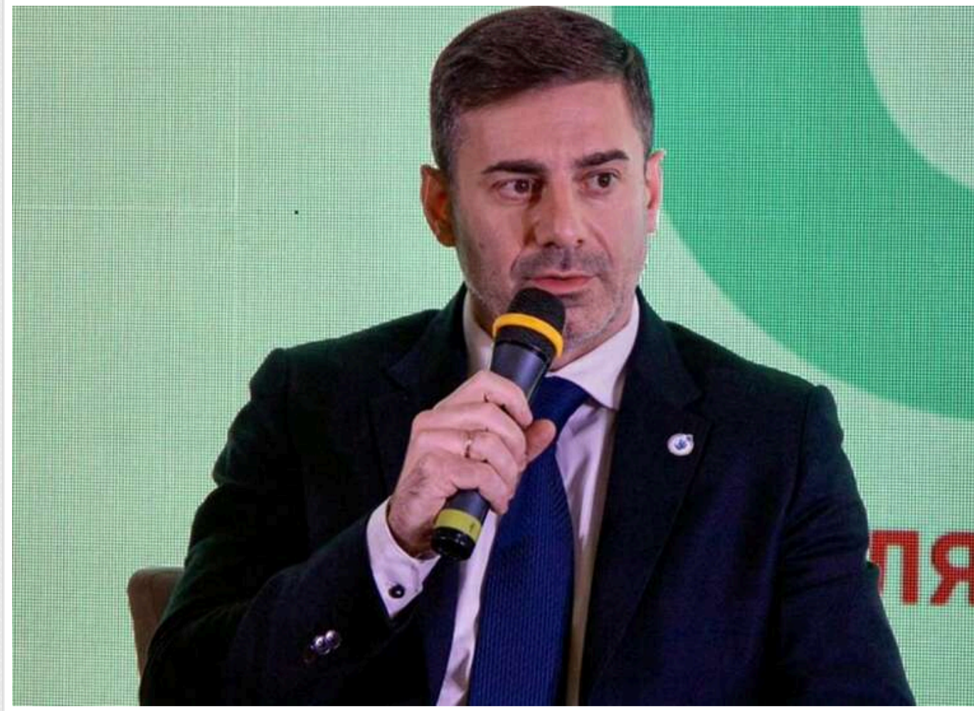
У Тернопільському ТЦК незаконно утримували людей з інвалідністю та психічними розладами, – Лубінець

Читати на руском Read in English Додати як бажане джерело в Google