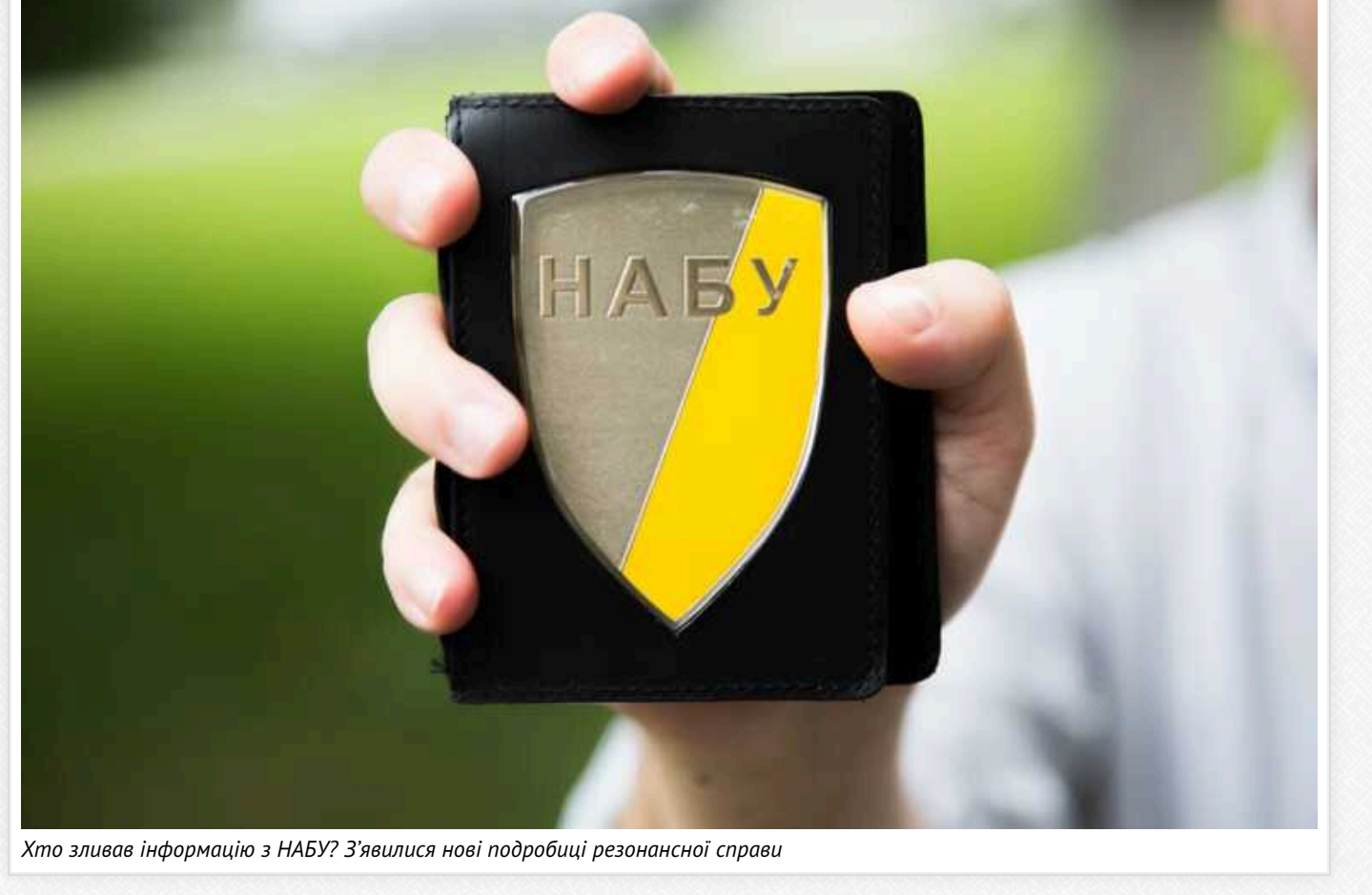
Хто зливає інформацію з НАБУ? З'явилися нові подробиці резонансної справи

Читати на руському | Додати як об'єкт закладки в браузері