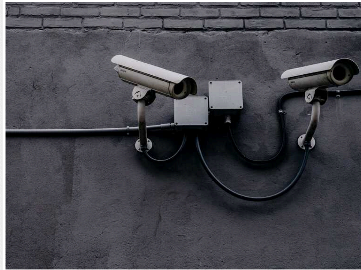
В Україні запровадять систему відеонагляду за громадянами й звірки їхніх даних для ідентифікації

Читати на руском Read in English Додати як бажане джерело в Google