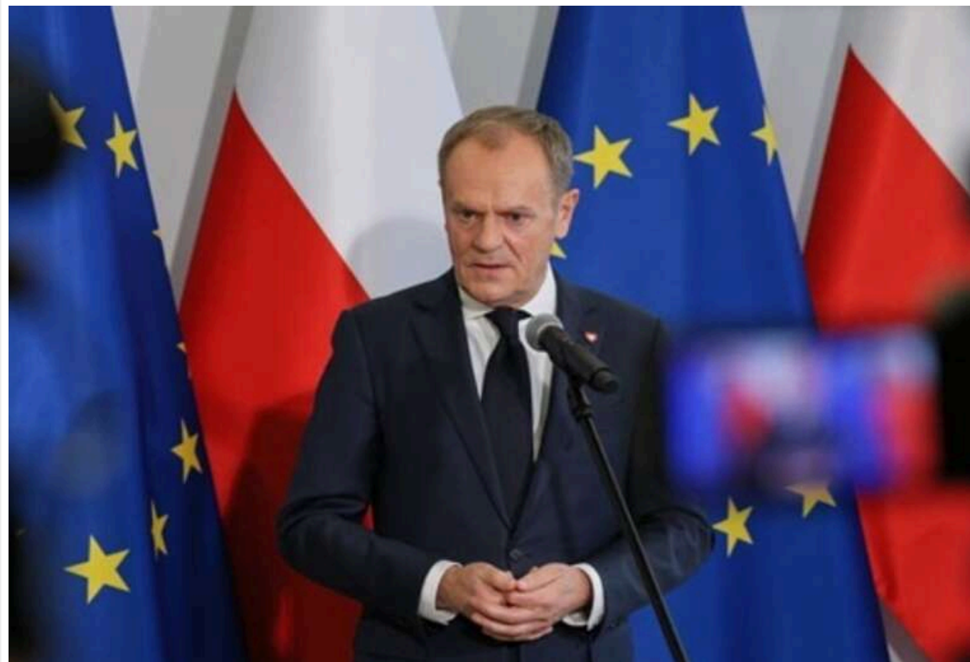
На церемонії визволення Освенциму не затримають жодного представника Ізраїлю, - Туск

На церемонії 80-річчя звільнення в'язнів концтабору в Освенцимі у Польщі не буде затримано жодного представника Ізраїлю.