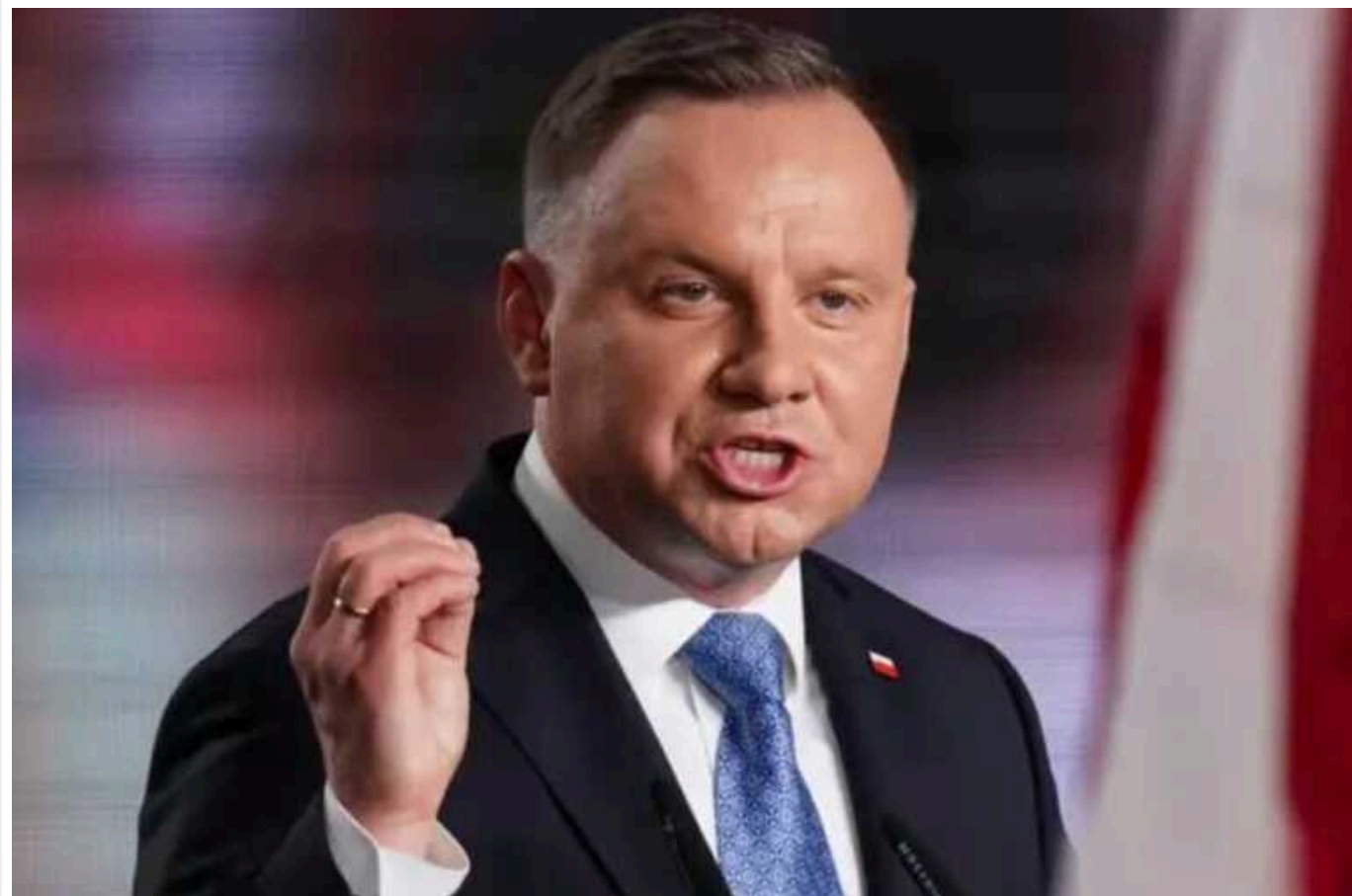
Президент Польщі заперечив чутки про помилування агента ГРУ, виданого РФ

Президент Польщі Анджей Дуда прокоментував великий обмін ув'язненими між Заходом і Росією, щоб спростувати повідомлення, що з'явилися в мережі на цю тему.