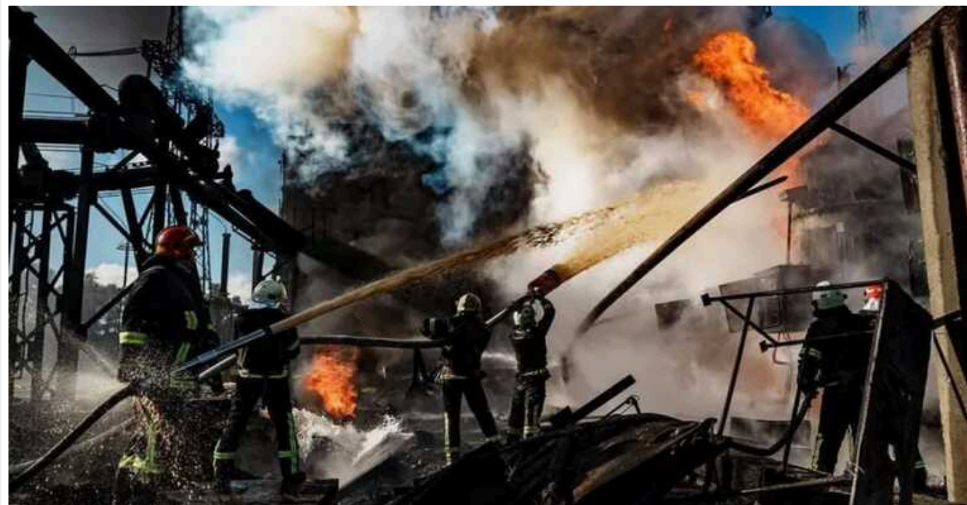
У ГУР оцінили, чи здатна РФ повністю знищити українську енергетику

Росія докладляє максимальних зусиль для знищення української енергетики і удари РФ можуть значно ускладнити роботу енергосистеми. Однак повністю знищити енергетику України окупантам не вдасться.