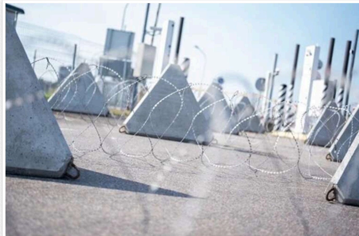
Європа готується до "немислимого" сценарію в разі війни з РФ: Литва замінує прикордонні мости та встановить бетонні загородження

Читати на русском Додати як бажане джерело в Google