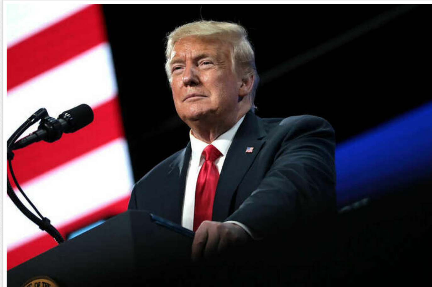
Рейтинг Трампа впав до найнижчого рівня з моменту повернення в Білий дім, – опитування

Рейтинг схвалення президента США Дональда Трампа знизився до найнижчого рівня з моменту його повернення до Білого дому.