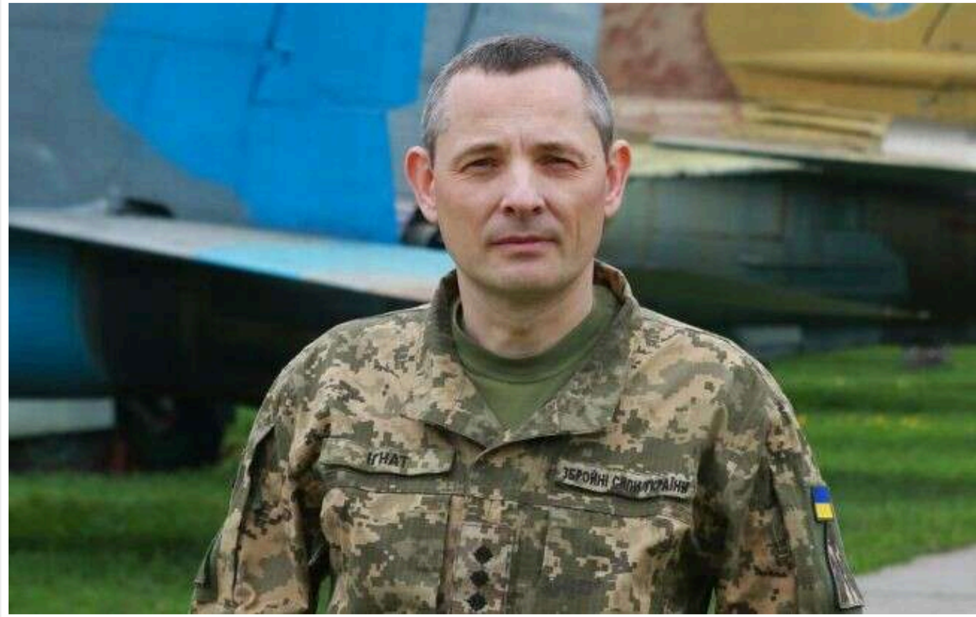
Ігнат прокоментував російську атаку по Києву: Важко увяйти, що було б, якби всі балістичні ракети влучили в ціль

Читати на руском Додати як бажане джерело в Google