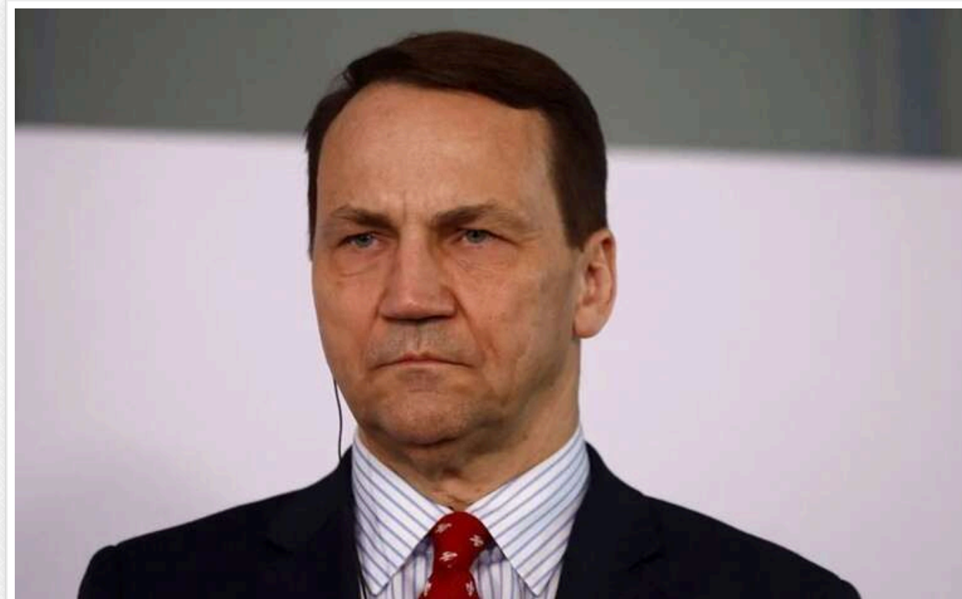
Ви більше ніколи не будете правити тут: ні в Києві, ні у Вільнюсі, ні в Ризі, ні в Таллінні, ні в Кишиневі, - Сікорський звернувся до Росії

Росія мусить нести відповідальність за агресію проти України та відмовитися від амбіцій домінування у Східній Європі.