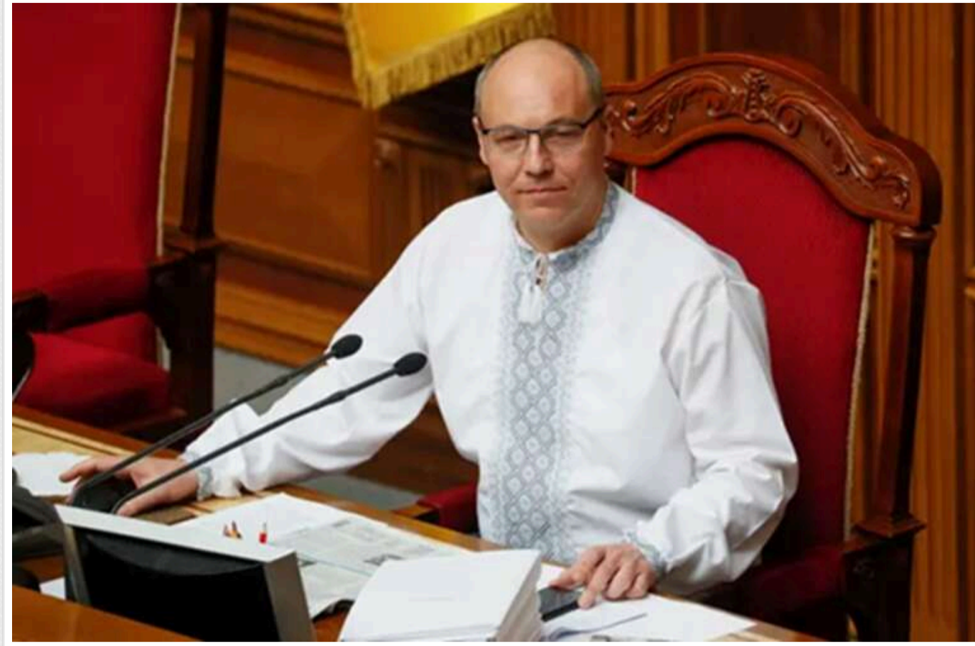
Поліція: Підозрюваний мав "певні обставини" для вбивства Парубія

Читати на руском Read in English Додати як бажане джерело в Google