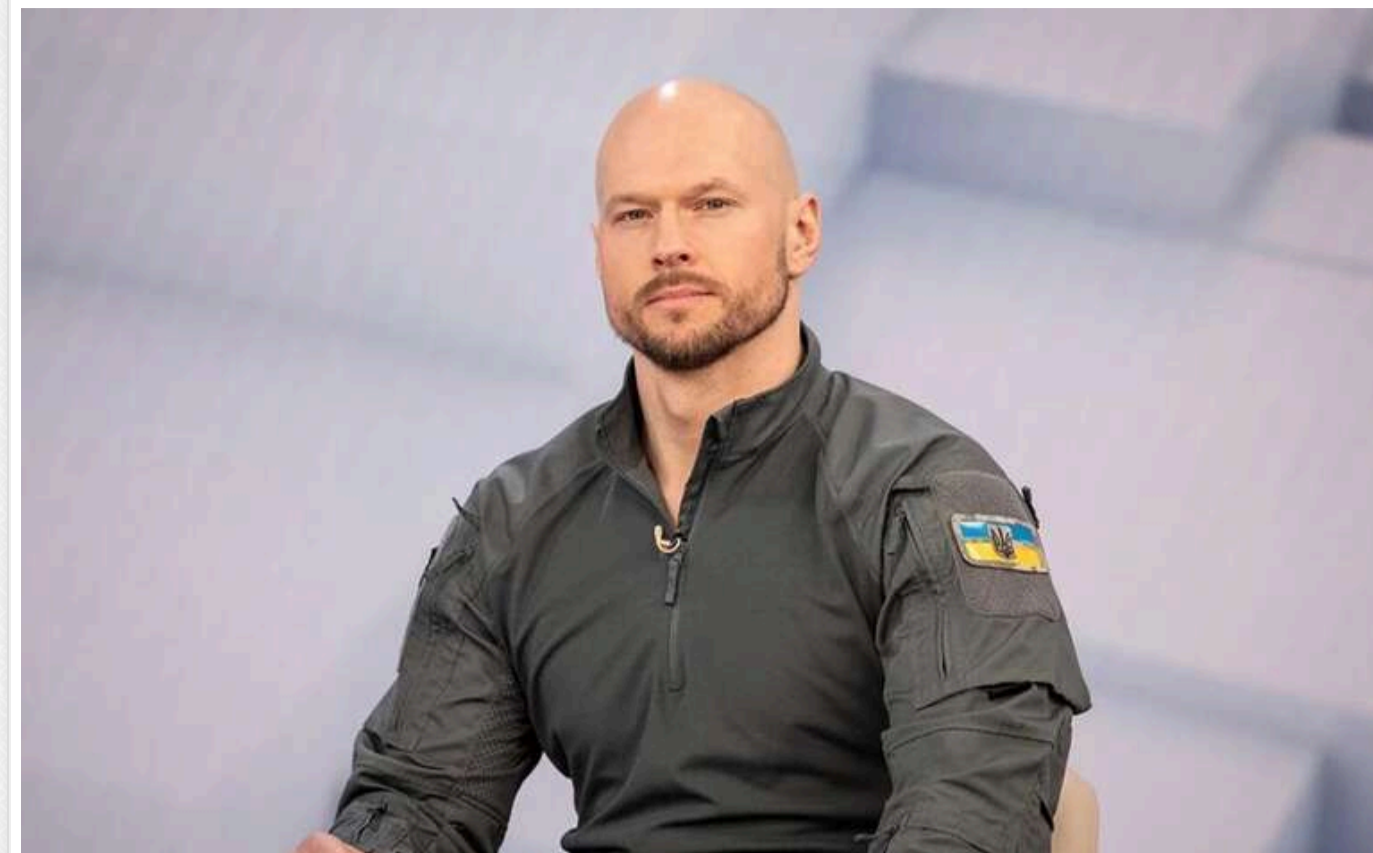
СБУ назвала підозру НАБУ проти ексголови кібердепартаменту Вітюка "помстою"

Читати на руском Read in English Додати як бажане джерело в Google