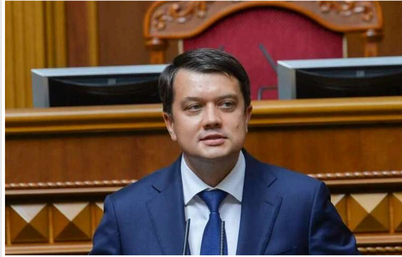
Загроза блекауту - 90%: Разумков заявив про зміну тактики ворога – удари по трансформаторах і об'єктах "Укрзалізниці"

Читати на руском Read in English Додати як бажане джерело в Google