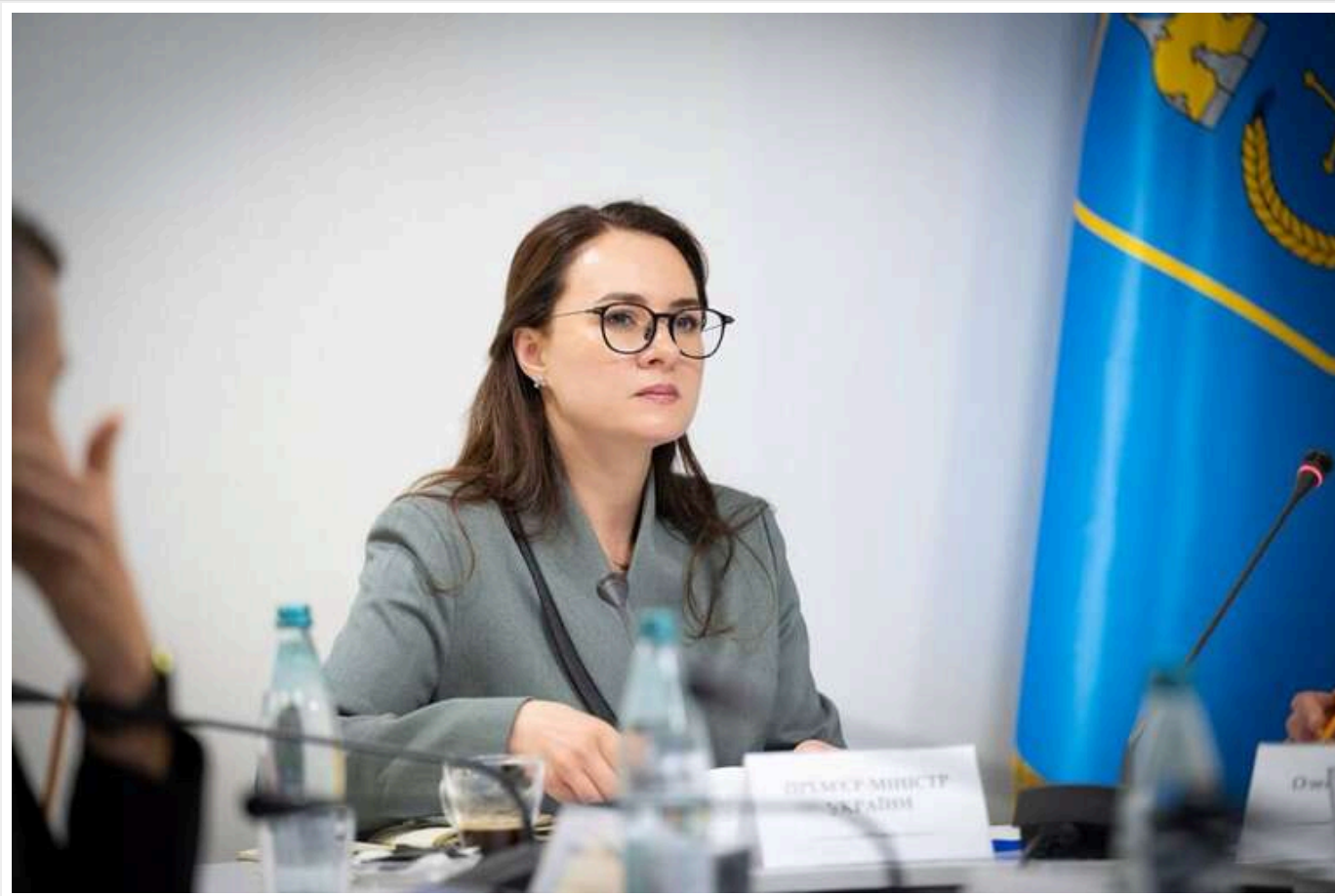
Кабмін зафіксував ціну на газ для населення до 31 березня 2026 року

Ціни на газ для побутових споживачів в Україні не змінюватимуть до 31 березня 2026 року. Кабмін ухвалив відповідне рішення.