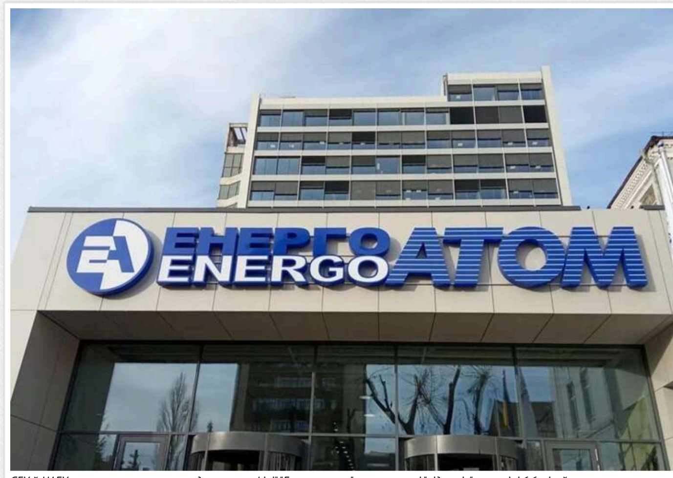
СБУ й НАБУ викрили заступницю гендиректора філії "Енергоатому" на вимаганні "відкатів" у розмірі 6,6 мільйона гривень

НАБУ та САП викрили заступницю генерального директора філії «Атоменергомаш» АТ «НАЕК «Енергоатом» у вимаганні та отриманні неправомірної вигоди від представника компанії-підрядника.