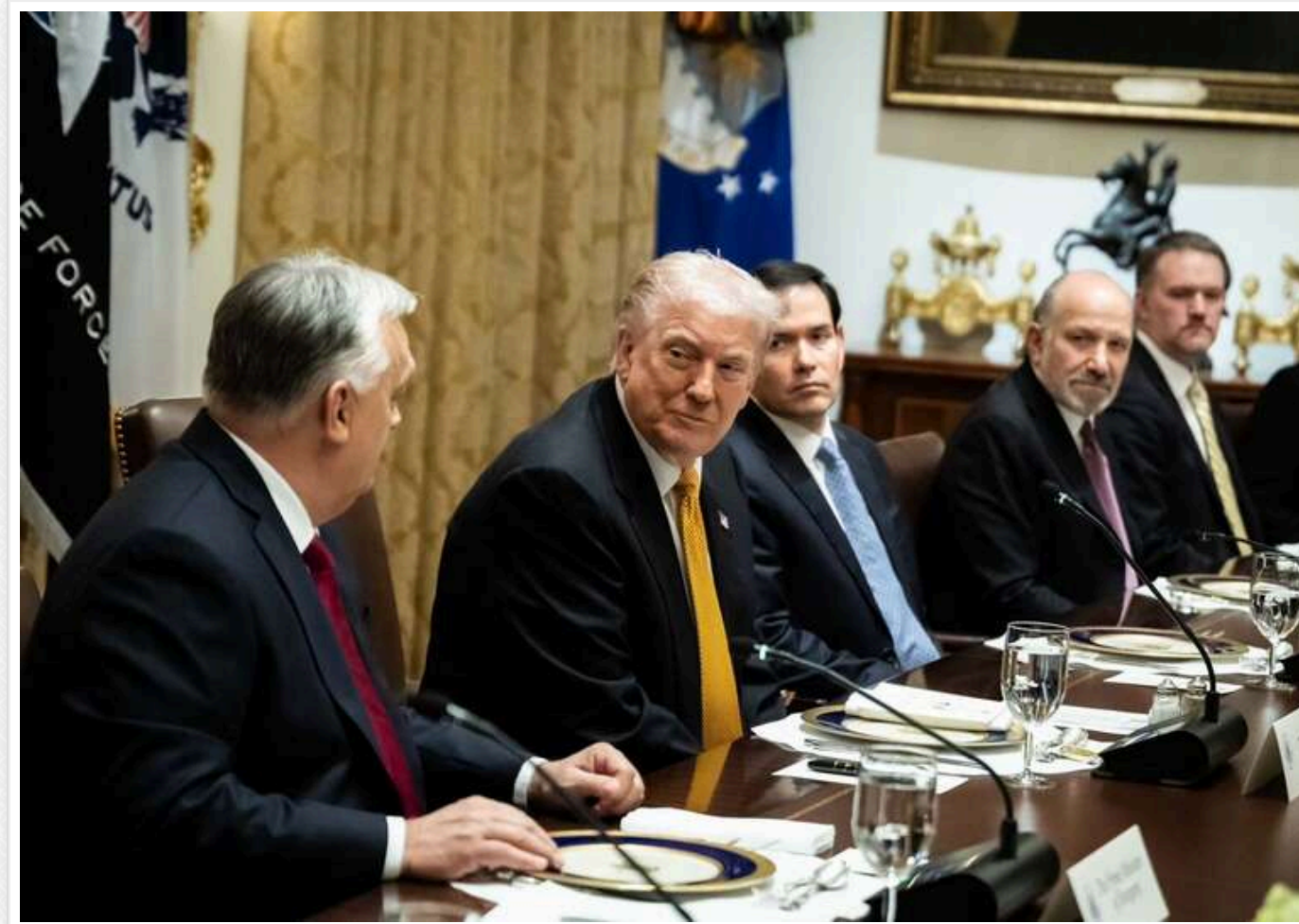
Угорщина стверджує про безстрокове звільнення від санкцій США на купівлю газу та нафти у РФ, але Білий дім Трампа підтвердив відстрочку лише на один рік

В адміністрації президента Сполучених Штатів Дональда Трампа підтвердили, що Угорщина отримала від США виняток із санкцій щодо закупівлі газу та нафти в Росії. Проте цей виняток не є безстроковим, як стверджують в Угорщині, а діє лише протягом одного року.