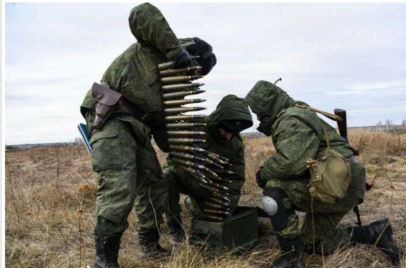
Окупанти розстріляли двох українських військових на околицях Затишшя Запорізької області, – Лубінець

Російські загарбники розстріляли ще двох українських військовослужбовців. Черговий воєнний злочин було скоєно на околицях селища Затишшя Запорізької області.