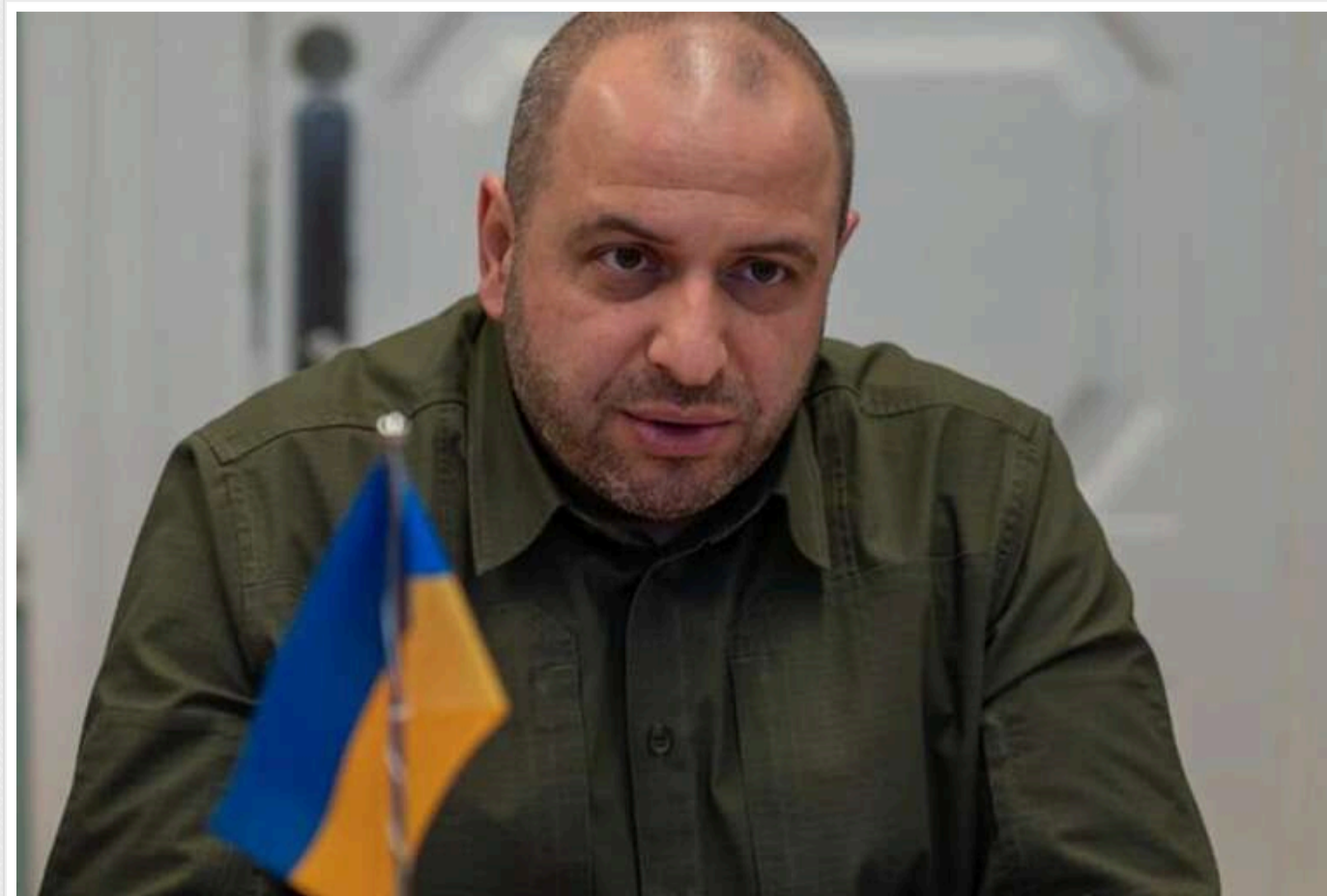
ЦПД: Умеров перебуває в США на робочих зустрічах і не відмовлявся повертатися в Україну

Читати на руском Read in English Додати як бажане джерело в Google