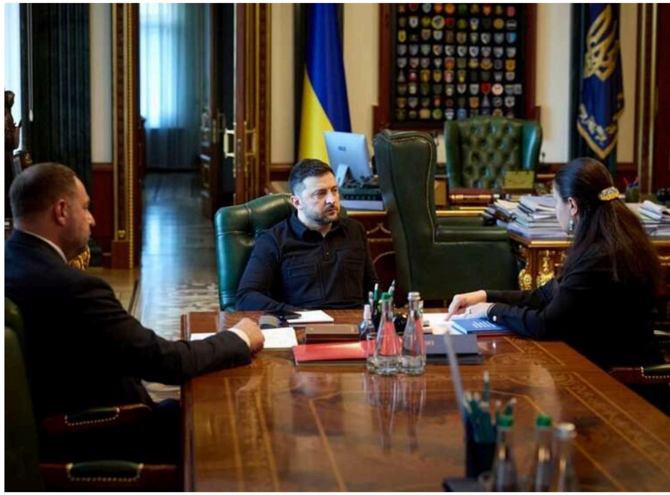
"Важливі оперативні рішення": Зеленський може звільнити Єрмака та призначити головою ОП Оксану Маркарову

Читати на руськом Read in English Додати як бажане джерело в Google