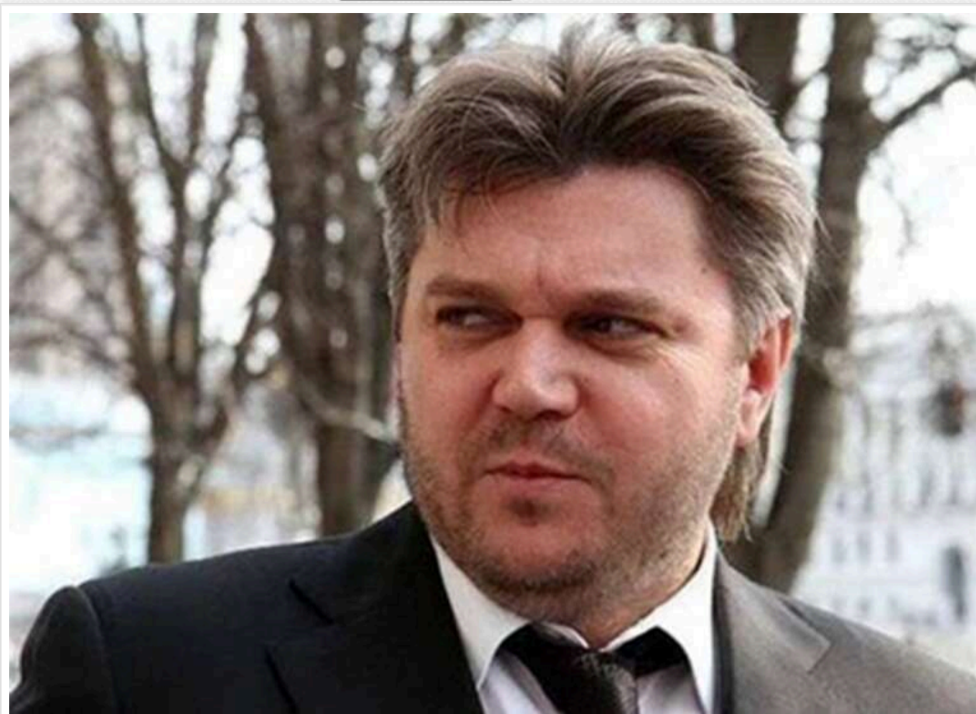
Золото й мільйони Ставицького пішли на оборону: Суд відмовив його батькові в поверненні 48 кг золота та 4,8 мільйона доларів готівкою

Читати на руськом Read in English Додати як бажане джерело в Google