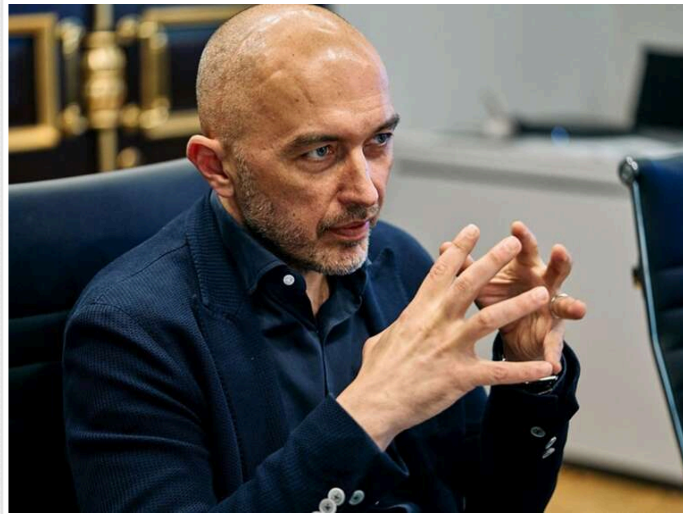
Хитається крісло під головою НБУ: Андрій Пишний ризикує втратити посаду через "Міндінгейт" та тиск на банки

Голова НБУ Андрій Пишний може втратити свою посаду, оскільки утримувався на ній завдяки підтримці голови ОП Андрія Єрмака. Існує ймовірність, що Пишний та його наближені особи причетні до справ Міндінгейту, зокрема через державний «Сенс банк» (Sens bank).