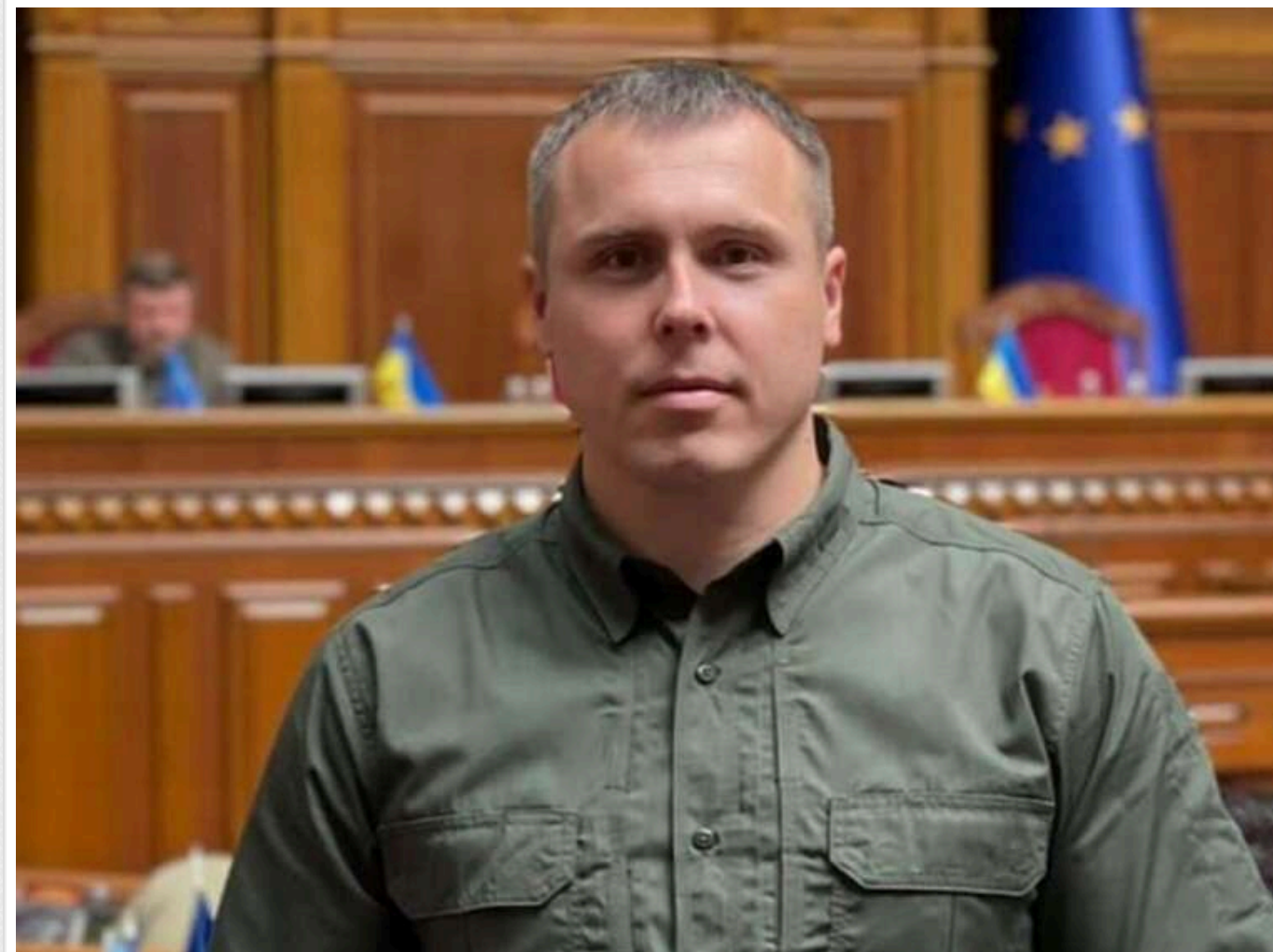
"Хто хоче воювати – б'ється, хто не хоче – виїжджає": нардеп Костенко про вибір країни

Народний депутат, секретар Комітету Верховної Ради з питань національної безпеки, оборони та розвідки Роман Костенко («Голос») запропонував суспільству визначитися між двома радикальними шляхами для забезпечення обороноздатності країни: загальною примусовою мобілізацією або новим "суспільним договором", який би чітко розділив ролі у війні.