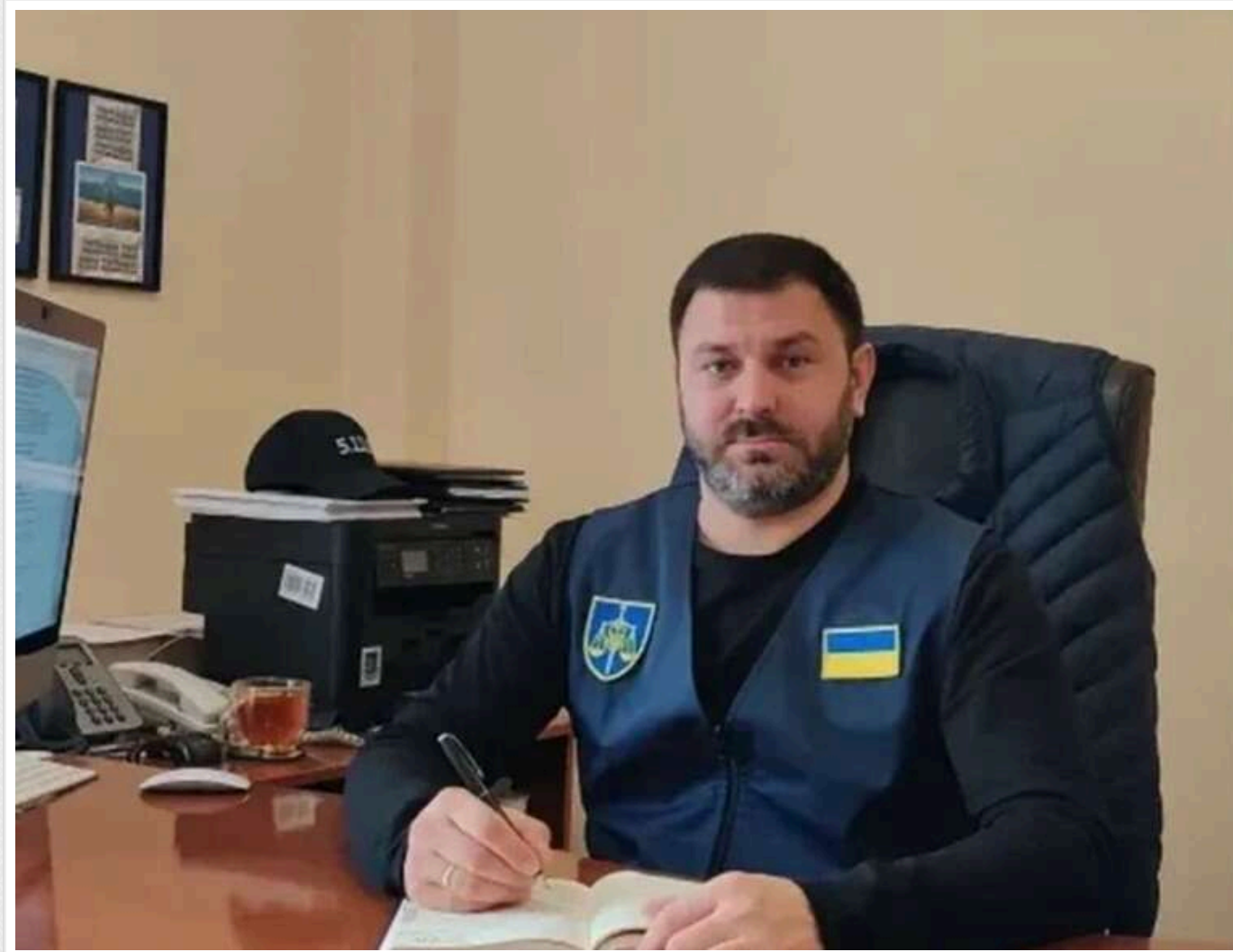
Прокурор Ізотов вийшов на пенсію у 44 роки з виплатою 219 тисяч гривень на місяць

Читати на руськом Read in English Додати як бажане джерело в Google