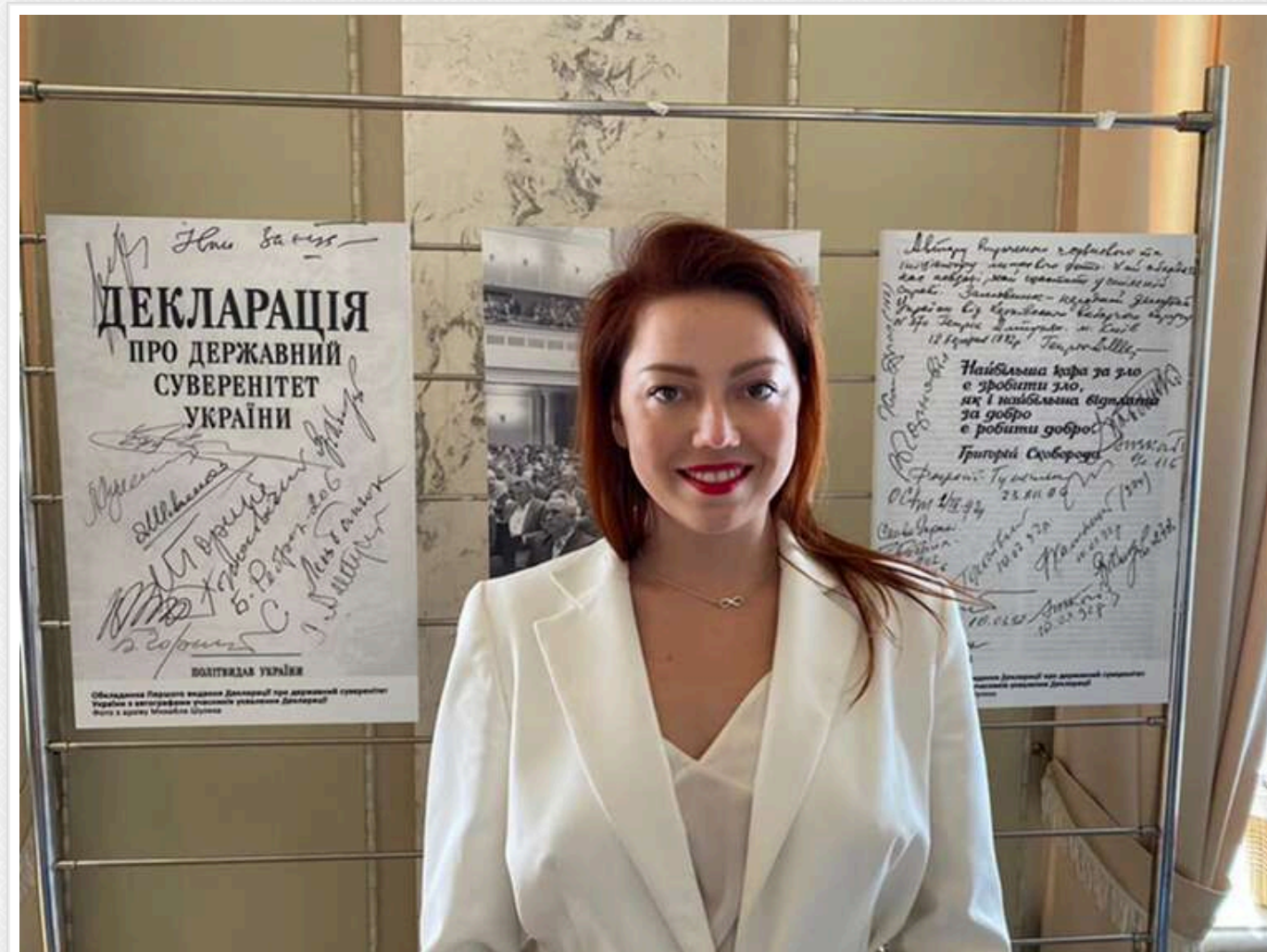
Шкрум спростувала власну заяву про "податок на відновлення": "Жодного податку не може бути"

Читати на руском Read in English Додати як бажане джерело в Google