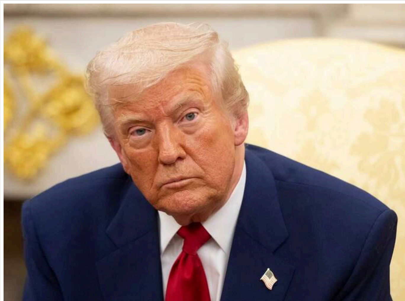
Трамп наказав заблокувати всі нафтові танкери, що прямують до Венесуели або з її вод

Президент США Дональд Трамп оголосив, що віддає розпорядження про повну блокаду всіх підсанкційних нафтових танкерів, які прямують до Венесуели або залишають її води.