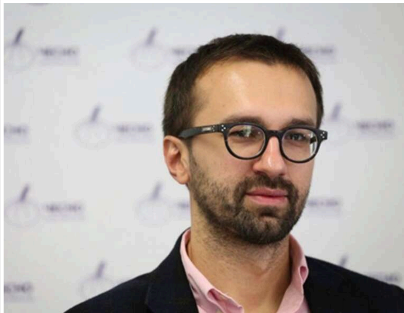
Mercedes за 190 тисяч доларів та нерухомість у Дубаї: чому спосіб життя Сергія Лещенка під час війни потребує публічних відповідей