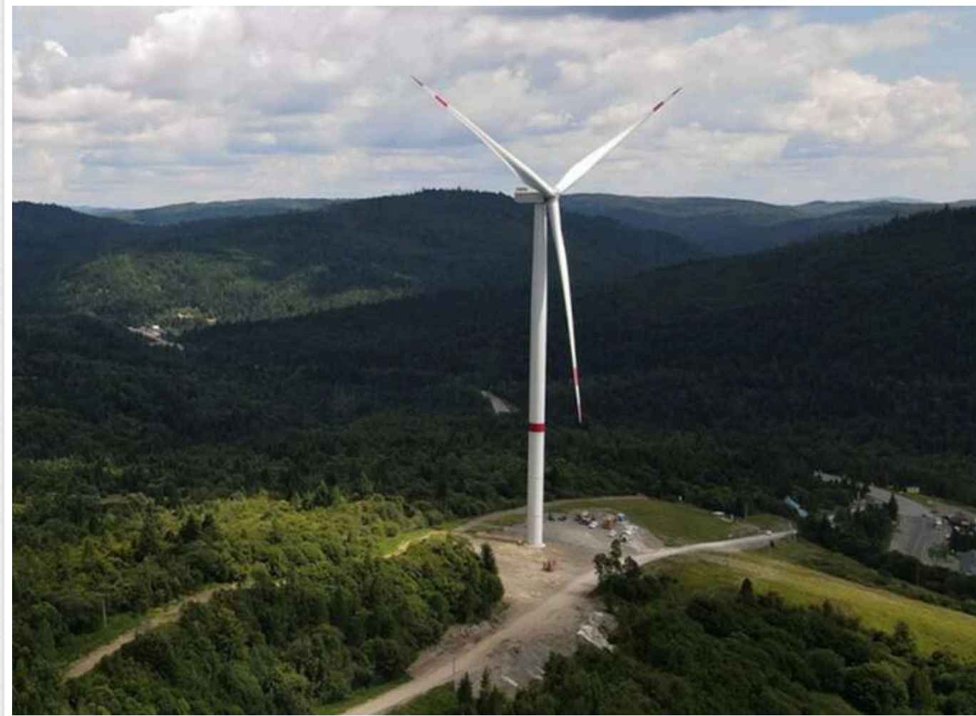
Вітряки Єфімова та схематоз: як уряд легалізував високогірну електростанцію в Карпатах

Міністерство економіки, навколишнього середовища та сільського господарства надало позитивний висновок щодо оцінки впливу на навколишнє середовище (ОВД) для будівництва вітрової електростанції на Полонині Руна на Закарпатті.