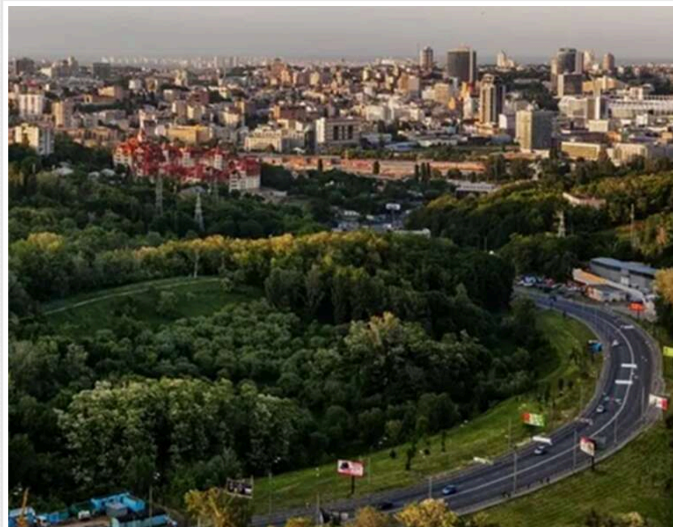
Суд скасував статус заказника у Протасовому Яру: зелену зону імені Романа Ратушного знову можуть забудувати

Суд дав зелене світло забудові Протасового Яру: анульовано статус заказника, названого на честь загиблого на війні активіста Романа Ратушного.