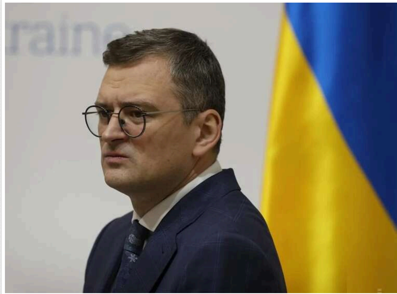
Кулеба: Податки в Україні зростатимуть, інакше шлях до ЄС залишиться закритим

Податки в Україні зростатимуть, інакше шлях до ЄС може залишитися закритим, – ексголова МЗС Дмитро Кулеба.